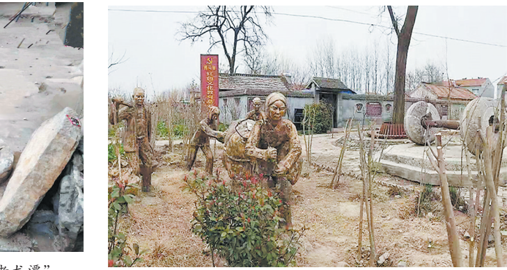
原金曹县抗日民主政府遗址