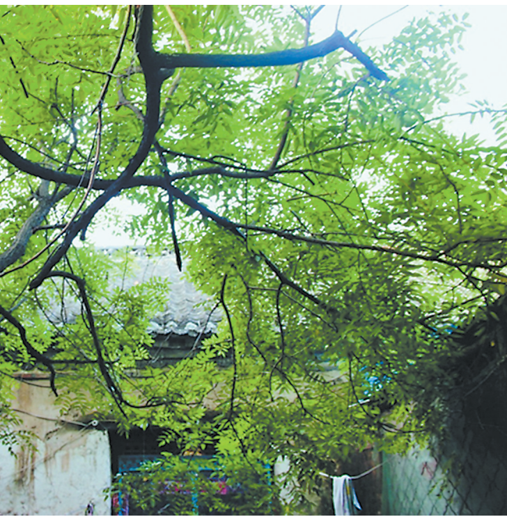
古槐掩映古屋 (资料片)