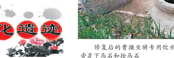
修复后的曹操坐骑专用饮水井“老龙潭”,一旁是下马石和拴马石

曹马集众多古建筑中,有一座金碧辉煌的琉璃大殿,正堂三间,三台连埦,高耸相望。炎热夏季,蛊毒滋生,唯独大殿东间不入苍蝇。原来有一天,曹操在殿内畅饮美酒,目视一只苍蝇盘旋佳肴美饌之上,即挥袖驱逐,并怒斥:“都到那边去,非扰吾好心情!”苍蝇随之销声匿迹,东间至此再无其类鬼魅踪影。 据《单县志》记载,因为曹操驻军养马,功劳卓著,曹马集成为非凡之地,名声大噪,兴元镇由此更名为曹马集,也成为历代达官贵族敬仰的圣地,相继建设了广生殿、大佛寺、观音阁、玉皇阁、碧霞元君殿等。清康熙三十年大佛寺记事石碑刻文:“创于汉,重葺于唐,续修于宋、金、元、明。” 清乾隆年间,朝廷在曹马集设置东方曹马保(“保”为旧时编制单位),1916年改为东区曹马保。抗战期间,曹马集为金曹县抗日民主政府驻地及曹马区委、区政府驻地,成立了中共单东北第一个农村党支部,是著名的抗日根据地。 建乡愁之“乡”,留古镇之“古”。曹马集是单县历史文化名村、红色文化教育基地,挖掘修复了饮马古井,建设了曹马集民俗博物馆,恢复了金曹县抗日民主政府遗址。 春夏之交,遍布村境的百余株百年刺槐花团锦簇,清香四溢,招来蜜蜂如饥似渴地采集生活的甜蜜,也吸引城里人享受历史文化、红色文化和生态文化营造的幸福向往。山东泰山旅游规划设计院院长常德军曾以曹马集为例,认为“发展古镇旅游重点是找到古镇的文化载体,重塑古镇文化的灵魂,再造古镇的组织肌理,恢复古镇生态,重现古镇的生机和繁荣。” 文/图 通讯员 刘厚珉