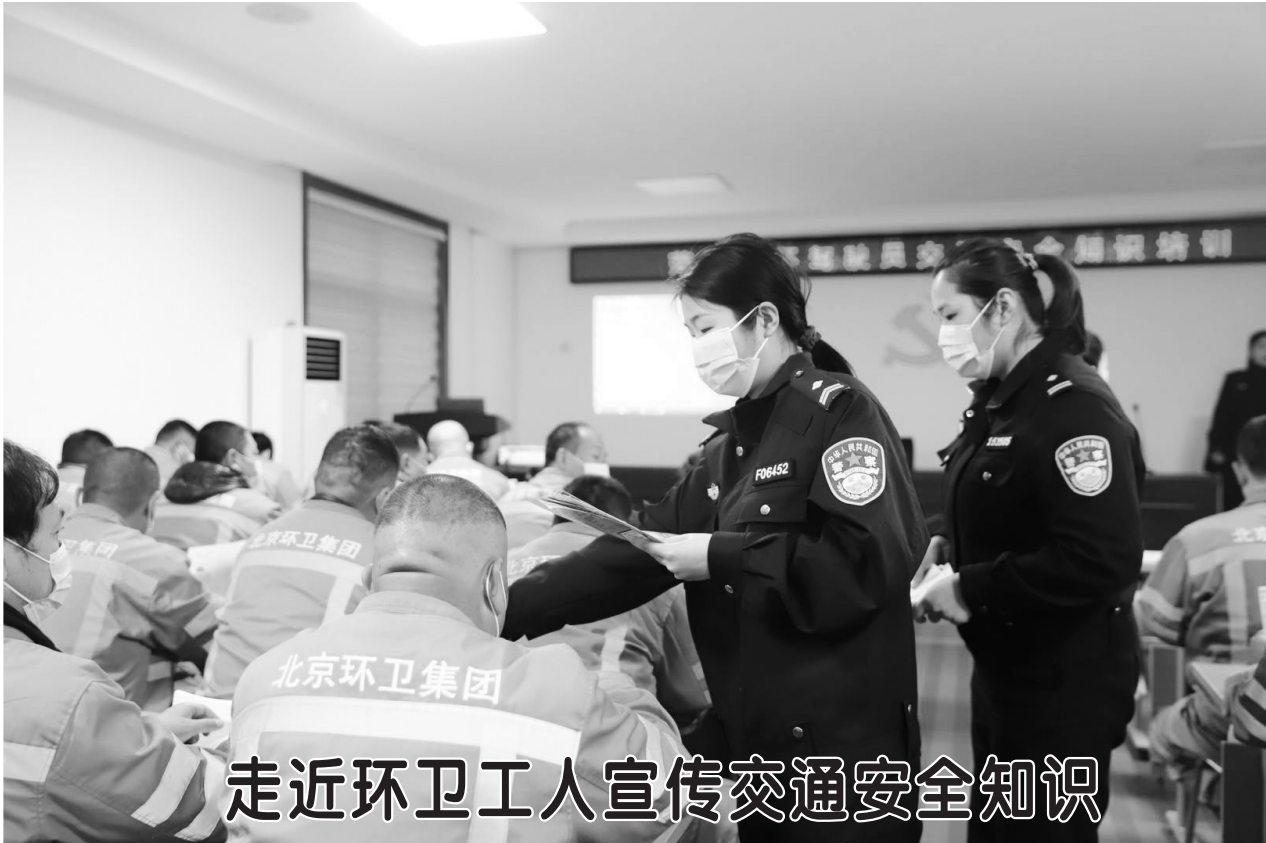
走近环卫工人宣传交通安全知识

设步骤和时间节点,督促做好施工准备,确保各项园区基础设施建设快速有序推进。 练建军强调,要坚持问题导向,提升服务意识,主动为企业排忧解难。要认真分析工程项目建设过程中面临的形势,明确工作任务,强化工作举措,确保各项工程按照时间节点和进度要求高效有序推进。