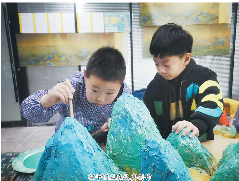
孩子们正在认真创作