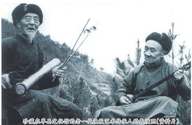
珍藏的单县文化馆的一代渔鼓艺术传承人的表演照(资料片)