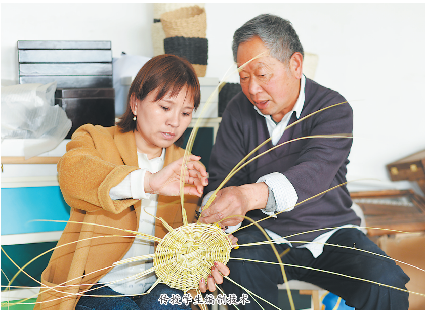
传授学生编制技术