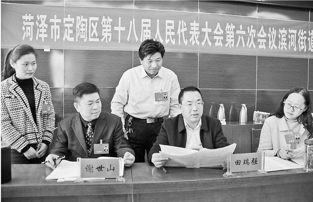
3月21日至24日,定陶区第十八届人民代表大会第六次会议在区委党校召开。3月22日,滨河街道代表团的代表正在讨论《政府工作报告》。

今后五年,定陶区将全面推进“六个突破”,着力当好全市“率先突破、后来居上”的排头兵。 全面推进重点产业实现新突破,坚持全链条打造生物医药产业,着力提升农副产品精深加工产业,培育壮大新能源新材料产业,大力发展现代服务业,全力打造具有相对优势、支撑财源建设的“1+3”特色产业体系。 全面推进乡村振兴实现新突破,大力发展现代农业,探索打造农业强、农村美、农民富的乡村振兴齐鲁样板“定陶新路径”。 全面推进城市功能实现新突破,主动对接和承接大市功能,深入开展“城市品位提升三年行动”,持续推进全国文明城市创建。 “人人都是营商环境!”区委书记朱中华说。定陶区要全面推进营商环境实现新突破,大力优化政务环境、法治环境和诚信环境。 “在改革中前行!”朱中华说。定陶区要全面推进改革创新实现新突破,深化经济体制改革,推进行政体制改革,强化社会治理体制改革,强化企业创新主体地位,加快创新平台建设,加强科技人才培育。 区委区政府要全面推进民生改善实现新突破,实施积极的就业政策,办好人民满意的教育,改善医疗卫生条件,繁荣文化体育事业,健全养老服务体系和社会保障体系,深入推进平安定陶建设,持续改善生态环境。