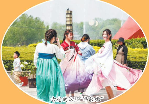
古老的汉服“年轻态”