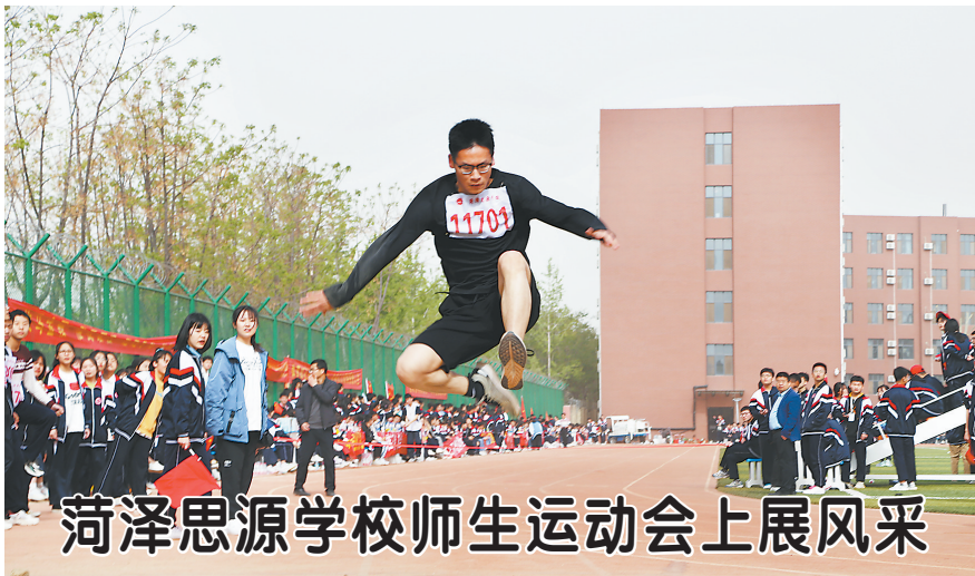
菏泽思源学校师生运动会上展风采

▲4月16日,菏泽思源学校举行了“培根铸魂 永记党恩”——第二届春季运动会。开幕式上,该校设计的“党史”发展方阵、“红船”方阵、“红军长征”方阵、“民族复兴”方阵等队伍依次登场,以庆祝中国共产党成立100周年。运动会共设田赛、径赛等两个大项及多个小项,高一、高二40支班级代表队和一个教工代表队近千名师生参赛。赛场上,运动健儿们精彩纷呈、奋力拼搏,展示了学生素质教育新面貌。本次运动会是对学生身体素质、体育运动水平的一次验收,也是对全校师生组织纪律性和精神面貌的一次大检阅。