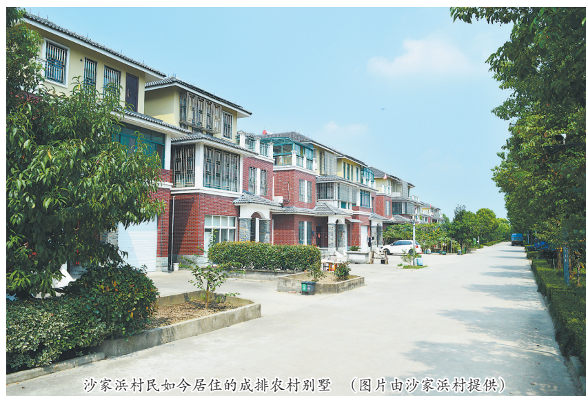
沙家浜村民如今居住的成排农村别墅