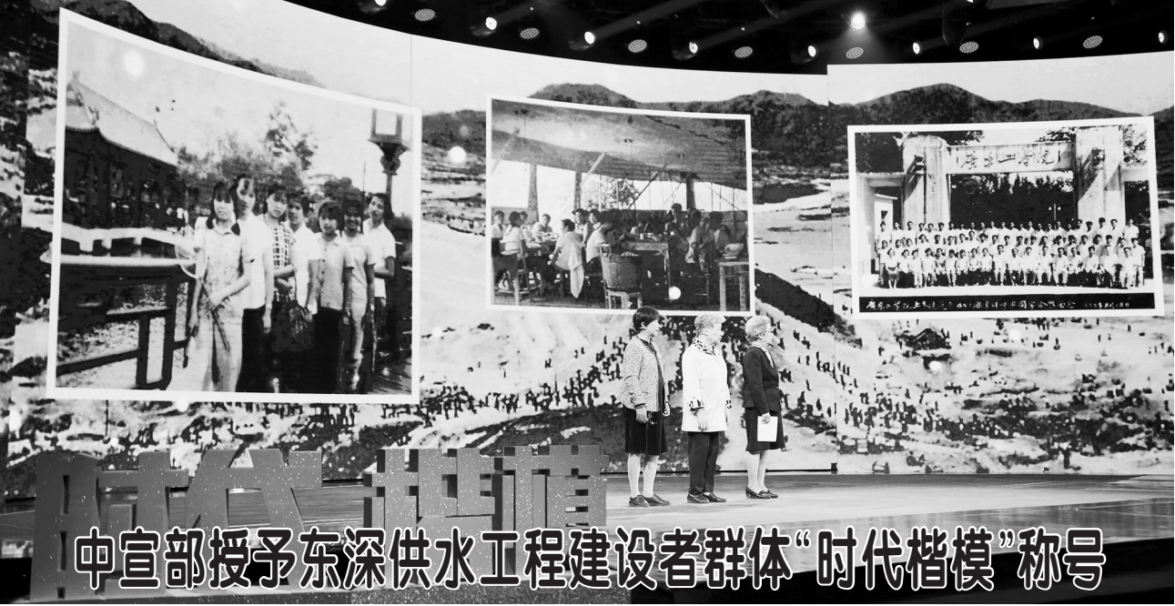
▲4月18日，三名东深供水工程建设者代表在“时代楷模”发布仪式上。在“十四五”规划开局、粤港澳大湾区建设深入推进之际，中宣部向全社会宣传发布东深供水工程建设者群体的先进事迹，授予他们“时代楷模”称号。