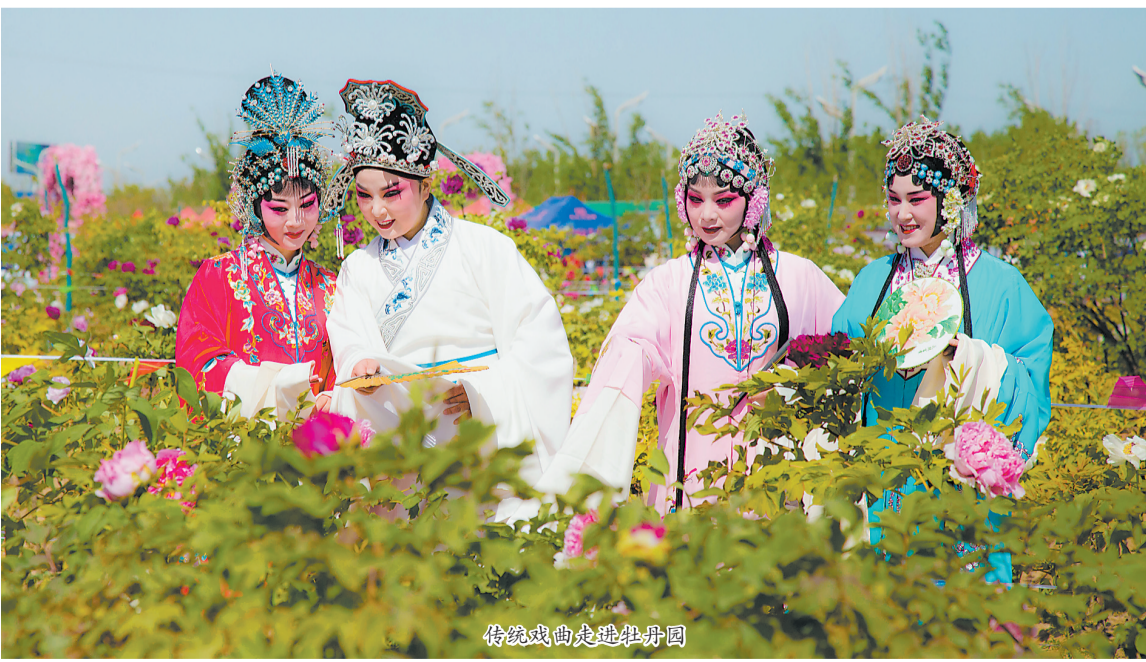
传统戏曲走进牡丹园

“花开花落二十日,一城之人皆若狂。”四月的菏泽,牡丹盛放,吸引大批游客前来观赏。除了姹紫嫣红的牡丹花,还有浓浓的“文化味儿”让游客流连忘返。