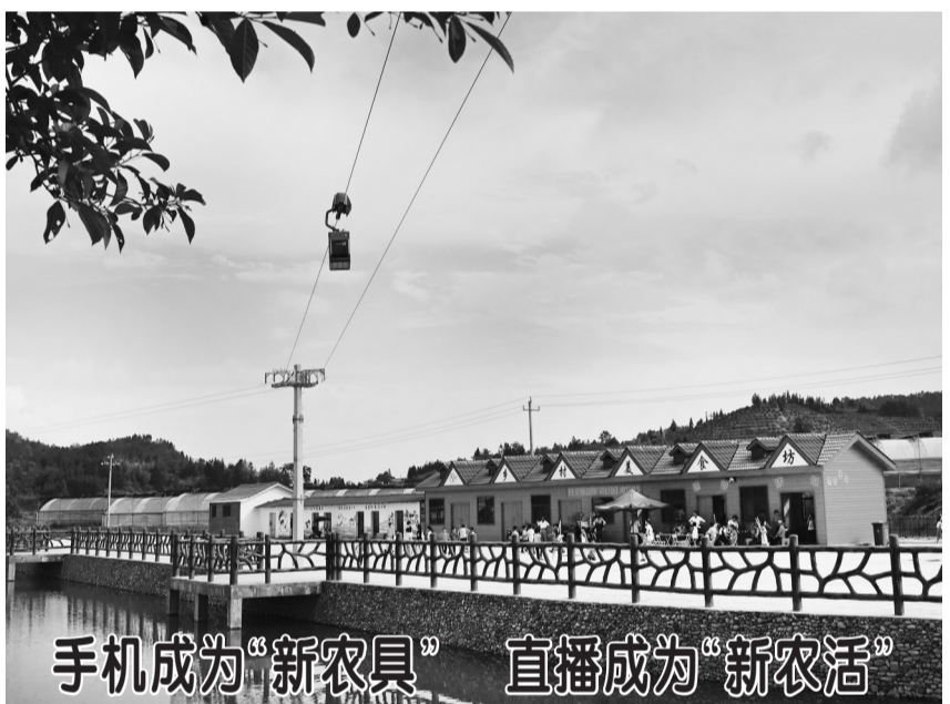
手机成为“新农具” 直播成为“新农活”

5月14日,穿梭机器人在鹤子镇佳村低空索道上运行。安远县2020年启动智慧快线“村村通”,解决了当前农村物流“小批量、多批次、即时配送”等需求,打通了农产品出村进城“最初一公里”。