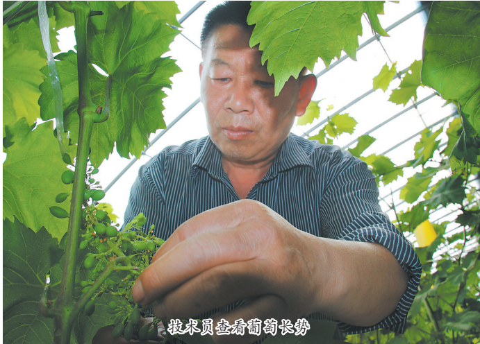
技术员查看葡萄长势