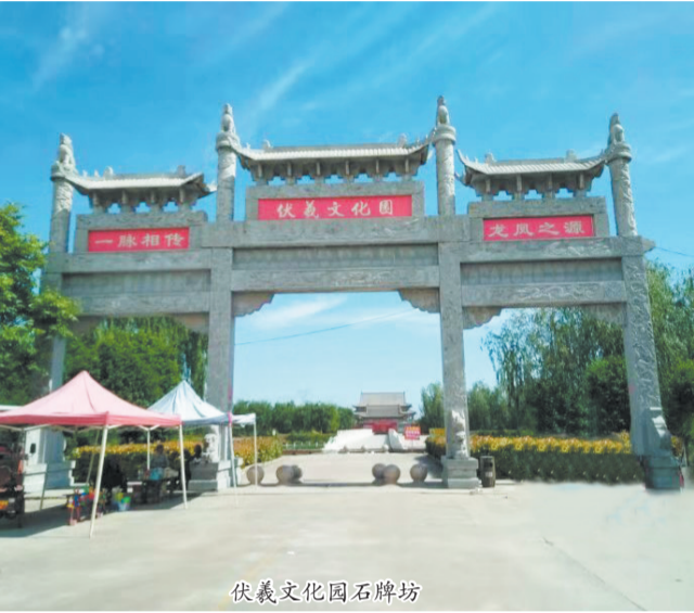
伏羲文化园石碑坊