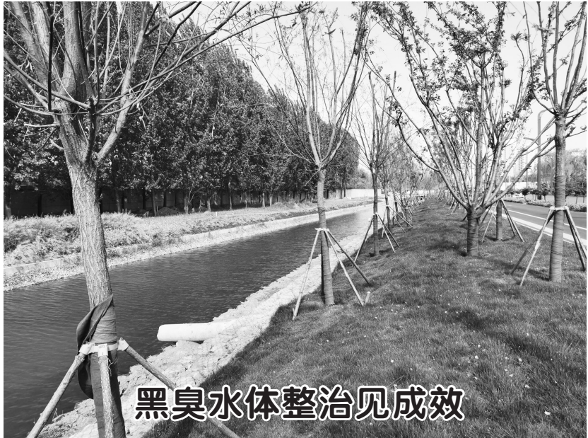
黑臭水体整治见成效

2019年以来，我市组织实施了包括东鱼河（菏泽段）建筑物与防汛路工程在内的5大类61项重点水利工程建设。工程建设期间，我市水务部门压实责任、跟进督查、科学组织、压茬推进工程建设。截至目前，9条重要河道治理、40座病险水闸除险加固、2座病险水库除险加固、1座平原水库、4项河道拦蓄以及闫潭沙沟开挖等57项工程完成建设任务，累计完成投资53.61亿元，治理河道317.2公里，筑堤441.8公里，为全力筑牢我市防洪抗旱安全堤坝奠定了坚实的基础。