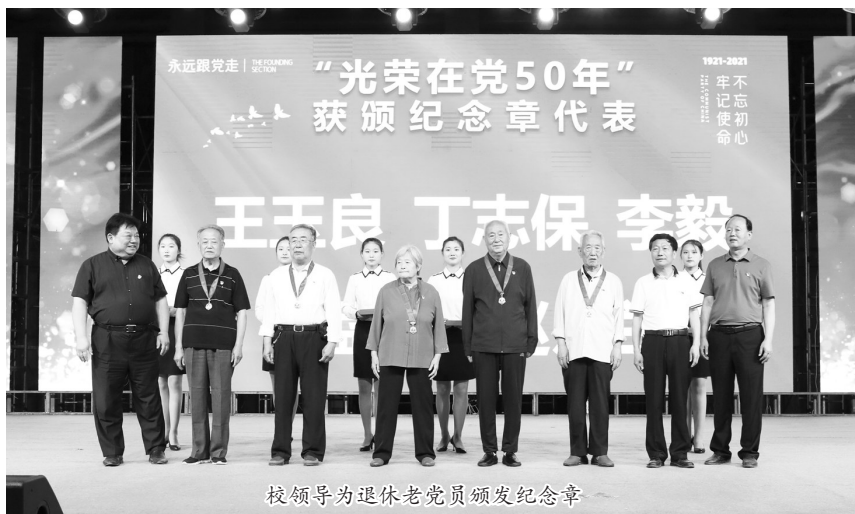
校领导为退休老党员颁发纪念章