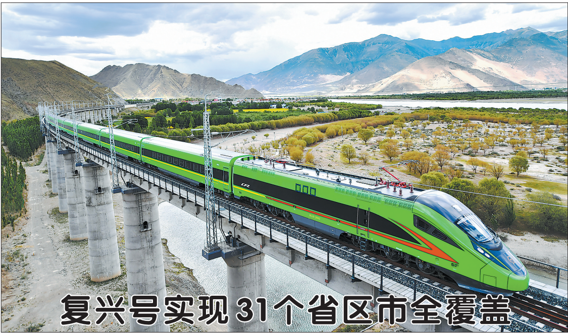
复兴号实现31个省区市全覆盖

新华社北京6月25日电 (记者 王优玲)住房和城乡建设部等15部门近日发布关于加强县城绿色低碳建设的意见。意见指出,要控制县城建设密度和强度,既要防止盲目进行高密度高强度开发,又要防止摊大饼式无序蔓延。 意见强调,县城建成区人口密度应控制在每平方公里0.6万至1万人,县城建成区的建筑总面积与建设用地面积的比值应控制在0.6至0.8。严守县城建设安全底线。县城新建建筑应选择在安全、适宜的地段进行建设,避开地震活动断层、洪涝、滑坡、泥石流等自然灾害易发的区域以及矿山采空区等,并做好防灾安全论证。 意见指出,要限制县城民用建筑高度。县城民用建筑高度要与消防救援能力相匹配。县城新建住宅以6层为主,6层及以下住宅建筑面积占比应不低于70%。鼓励新建多层住宅安装电梯。县城新建住宅最高不超过18层。确需建设18层以上居住建筑的,应严格充分论证,并确保消防应急、市政配套设施等建设到位。 意见还提出,严格控制县城广场规模,县城广场的集中硬地面积不应超过2公顷。保护传承县城历史文化和风貌,保存传统街区整体格局和原有街巷网络。不拆历史建筑、不破坏历史环境,保护好古树名木。