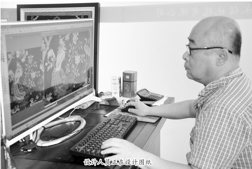
设计人员正在设计图纸