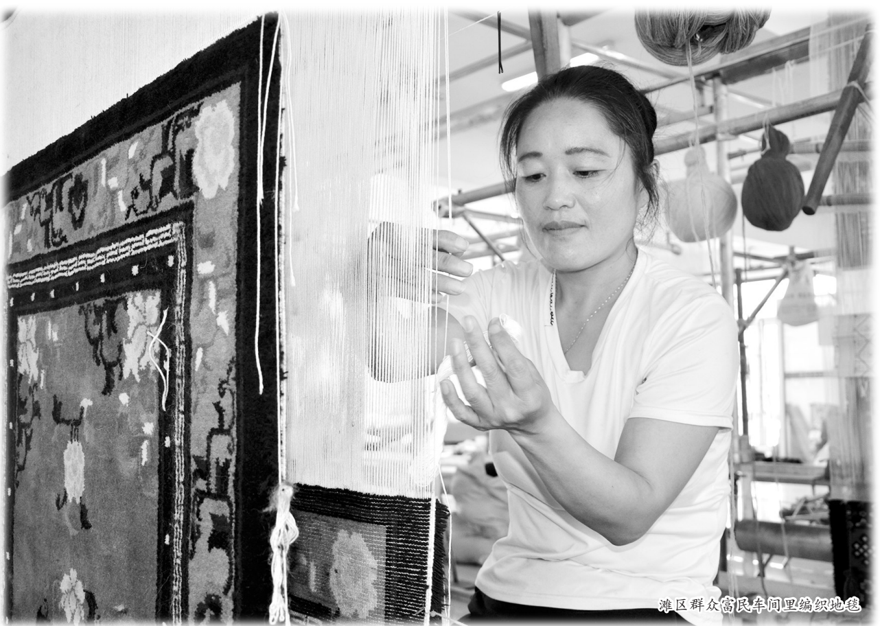
滩区群众富民车间里编织地毯