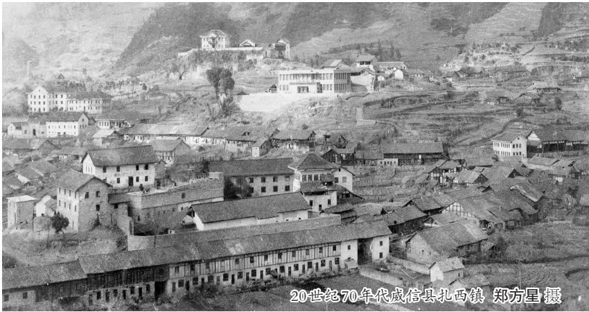
20世纪70年代威信县扎西镇