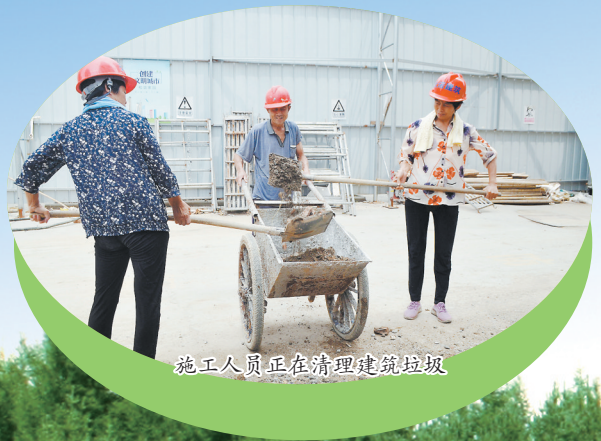
施工人员正在清理建筑垃圾

近日,记者走进市开发区陈集镇七一社区,在社区文化广场,树木参差有序、凉亭典雅别致,街道旁楼房星罗棋布,眼前的美景让人仿佛走进了美丽画卷,使人心旷神怡。