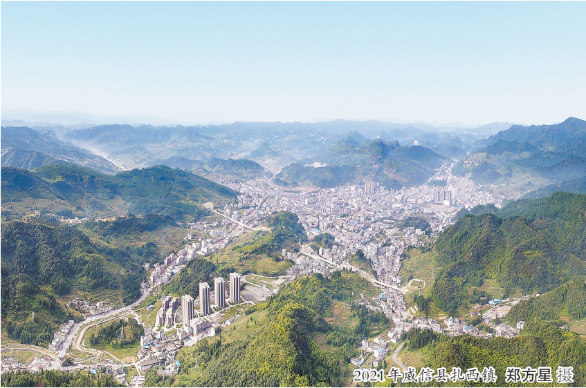
2021年威信县扎西镇

依托红色旅游,加强赤水河流域生态治理,围绕“红色文化、绿色食品、彩色风光、特色养殖”的产业发展思路,打造以方竹、生猪为主导的“1+N”高原特色产业。