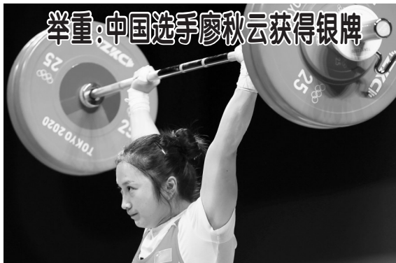
▲7月26日，中国选手廖秋云在比赛中。当日，东京奥运会举重女子55公斤级比赛在东京国际论坛大厦举行。中国选手廖秋云获得银牌。