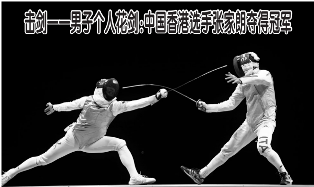
▲7月26日，中国香港选手张家朗（左）与意大利选手加罗佐在比赛中。当日，在东京奥运会击剑项目男子个人花剑决赛中，中国香港选手张家朗战胜意大利选手加罗佐，夺得冠军。

李克强强调，要细化并压实各方面、各层级、各环节责任，落实到人，对失职者严肃追责。认真总结经验教训，完善应急预案和相关制度，提高防范和应对重大突发事件能力。各地区各部门要在以习近平同志为核心的党中央坚强领导下，坚持以人民为中心，守护好一方平安，促进经济社会平稳健康发展。