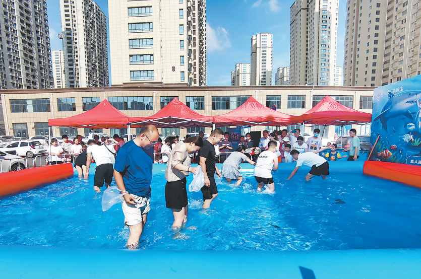
▲7月24日—25日,天安夏威夷真人捕鱼大赛欢乐开启,引燃了夏日里的“鱼”乐狂欢。虽然天气炎热,但是依然无法阻挡参与嘉宾的捕鱼热情。大家看着鱼池中活蹦乱跳的鱼儿,个个迫不及待、摩拳擦掌。随着一声令下,这场捕鱼大战正式打响,水池内的捕鱼达人们个个精神抖擞,不断地追赶鱼儿。水池外的观众也是热情高涨,忍不住高喊指引鱼的方向,现场热闹非凡。图为捕鱼活动现场。