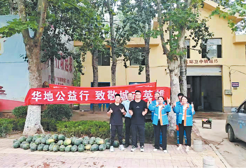
▲盛夏七月,热浪肆虐,气温持续飙升。近日,华地·翡翠公园秉承“大爱无疆 服务社会”的宗旨,开展“助力瓜农早回家 致敬城市的守护者”公益活动,用行动诠释企业的社会责任与担当。华地·翡翠公园的工作人员纷纷走上街头,为交警、环卫工人、建筑工人等在烈日下辛勤工作的城市英雄们送去爱心西瓜,并向他们致敬。

「建邦杯」全民健身羽毛球大赛落幕 本报讯(记者 李亚楠)近日,经过两天的激烈角逐,第三届“建邦杯”全民健身羽毛球大赛赛完美落幕。 虽然比赛时间正值酷暑,但丝毫没有影响运动员们的参赛热情,他们将汗水尽情挥洒在赛场,释放着激情和活力。经过多轮激烈角逐,大赛冠亚军分别出炉,实力争夺之战也落下了帷幕。 菏泽建邦公园项目负责人表示,建邦地产集团始终站在城市发展的角度,与菏泽共荣,不仅积极促进菏泽市体育事业的发展,在生态建设以及人居品质的改善上也是不遗余力地奉献,打造了约200亩生态公园,集运动、休闲、观景和生态改良于一体。在倡导美好生活的主旋律下规划了97—260平方米全生命周期户型,可满足全龄段、全方位需求的美好生活家。在未来,建邦地产集团将始终保持与城市共成长的初心,建设美丽菏泽、生态菏泽,打造更理想的人居环境而不懈努力。