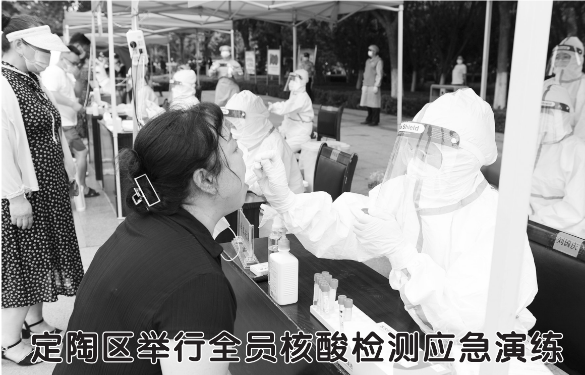
定陶区举行全员核酸检测应急演练

8月5日,定陶区委统筹疫情防控和经济运行工作领导小组在镜湖广场举行全员核酸检测应急演练。演练假设发生疫情后,迅速启动应急预案,快速完成全区范围内全员核酸检测。定陶区有关领导,省市疫情督导组成员,区委疫情指挥部有关成员单位主要负责人,各镇街及各卫生院负责人参加了演练。