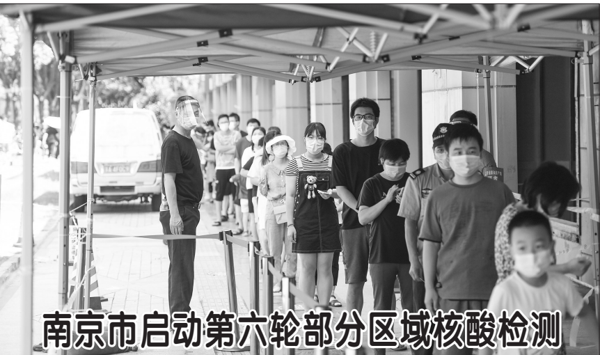
南京市启动第六轮部分区域核酸检测

截至8月7日24时，据31个省(自治区、直辖市)和新疆生产建设兵团报告，现有确诊病例1507例(其中重症病例44例)。