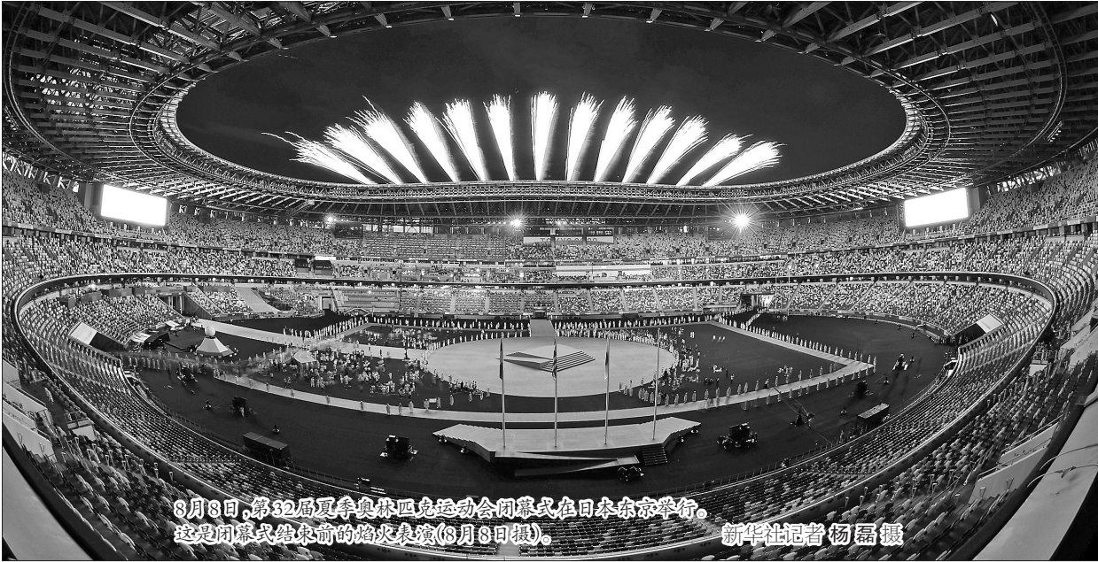
8月8日，第32届夏季奥林匹克运动会闭幕式在日本东京举行。这是闭幕式结束前的焰火表演(8月8日摄)。