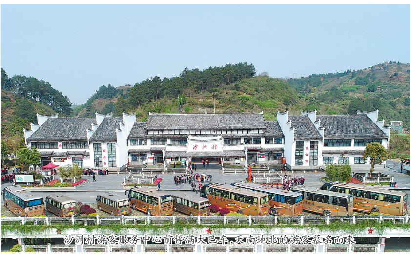
沙洲游客服务中心前停满大巴车,天南地北的游客慕名而来

宁愿自己挨冷受冻,也要把人民安危冷暖放在首位。“半条被子”的故事历久弥新,彰显了红军战士与父老乡亲的鱼水深情,彰显了共产党与人民群众同甘共苦,为人民谋幸福、为民族谋复兴的使命担当。 这,正是百年大党赢得人民群众真心拥护和支持的成功密码。