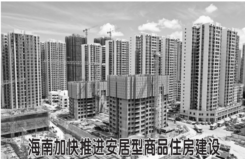
海南加快推进安居型商品住房建设

城市，让生活更美好；文明，让城市更美丽。今年，随着一项项举措的落实，一个个项目的推进，奋进在新时代的牡丹区必将更富魅力、更加出彩。