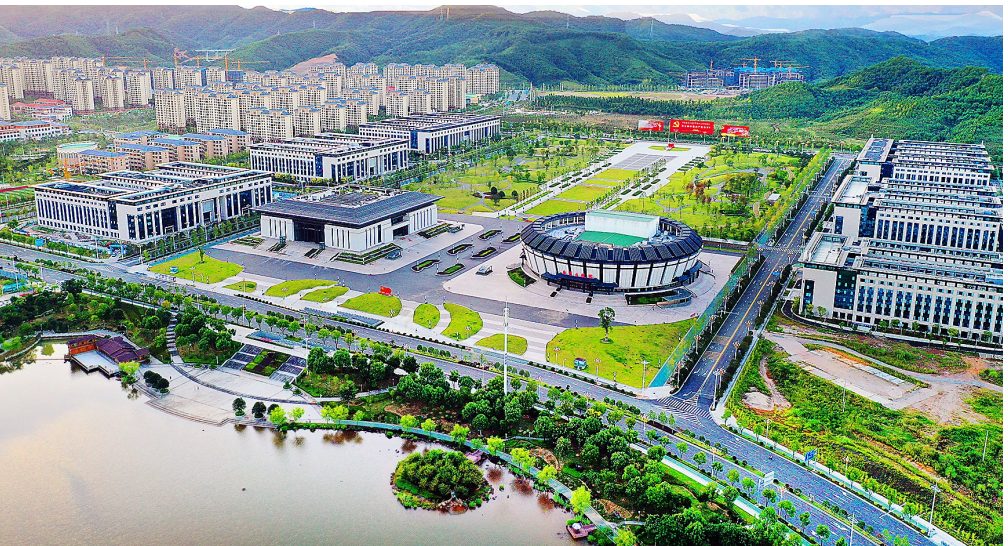
▲武夷新区作为南平发展的战略突破口,正在建设布局合理、设施配套、宜居宜业的新兴中心城市。

革命精神世代传扬,伟大事业不停接续。南平市认真学习贯彻习近平总书记来闽考察重要讲话精神,弘扬红色文化、传承红色基因,深入挖掘廖俊波精神的基本内涵及时代价值,立足资源禀赋、发