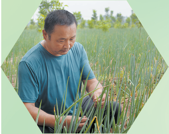
村民查看雨后大葱长势