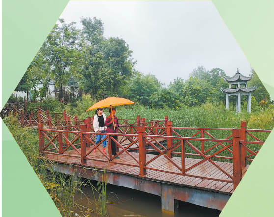
村民在雨中的公园里漫步