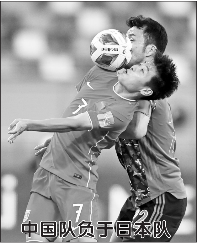
中国队负于日本队

新华社北京9月8日电 中央纪委国家监委网站8日发布消息,近日,中央纪委国家监委与中央组织部、中央统战部、中央政法委、最高人民法院、最高人民检察院联合印发了《关于进一步推进受贿行贿一起查的意见》,对进一步推进受贿行贿一起查作出部署。 意见要求,坚决查处行贿行为,重点查处多次行贿、巨额行贿以及向多人行贿,特别是党的十八大后不收敛不收手的;党员和国家工作人员行贿的;在国家重要工作、重点工程、重大项目中进行贿的;在组织人事、执纪执法司法、生态环保、财政金融、安全生产、食品药品、帮扶救灾、养老社保、教育医疗等领域行贿的;实施重大商业贿赂