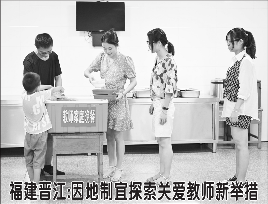
福建晋江:因地制宜探索关爱教师新举措

▲9月8日,在福建省晋江市永和镇群滨小学,老师在领取爱心家庭晚餐。该校为教师及其家人提供爱心家庭晚餐,晚餐按食材成本收费,可堂食也可打包。 新学期以来,福建省晋江市在积极落实“双减”政策的同时,鼓励各学校因地制宜探索关爱教师的新举措。一些学校根据所处位置的城乡差异和具体条件,推出教师爱心家庭晚餐、开辟教师爱心休息室、推行弹性上下班机制、为教师子女放学后提供看护等举措,从细微处入手关爱教师。