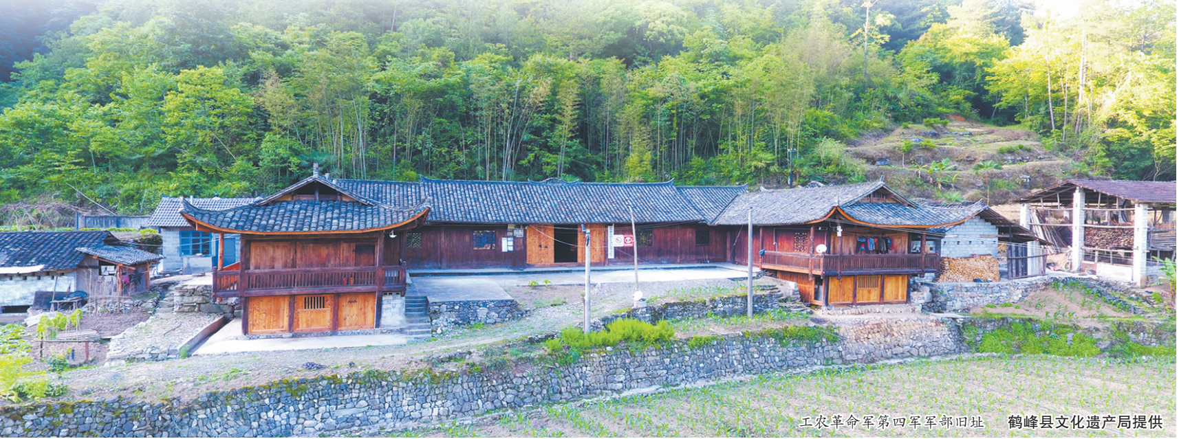
工农革命军第四军军部旧址