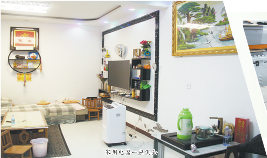
家用电器一应俱全