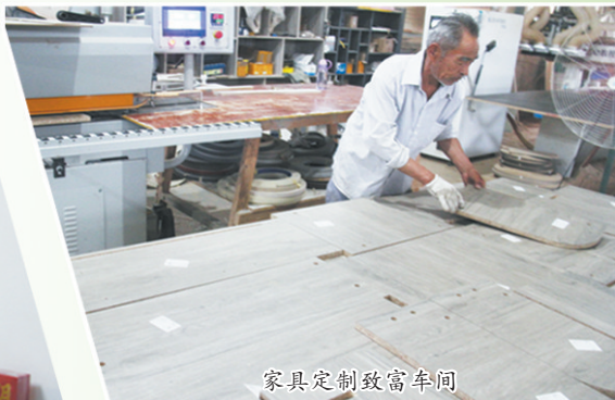
家具定制致富车间