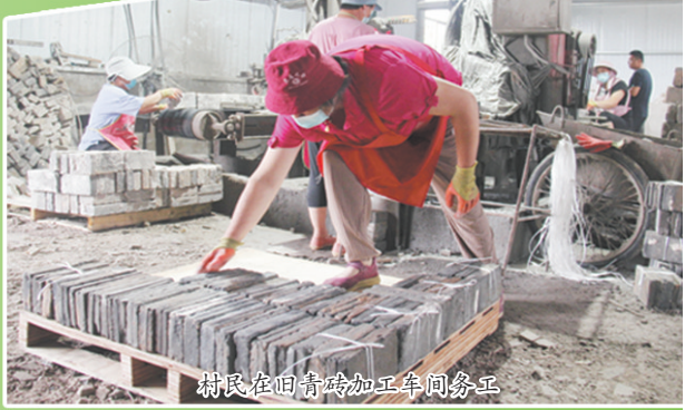
村民在旧青砖加工车间务工