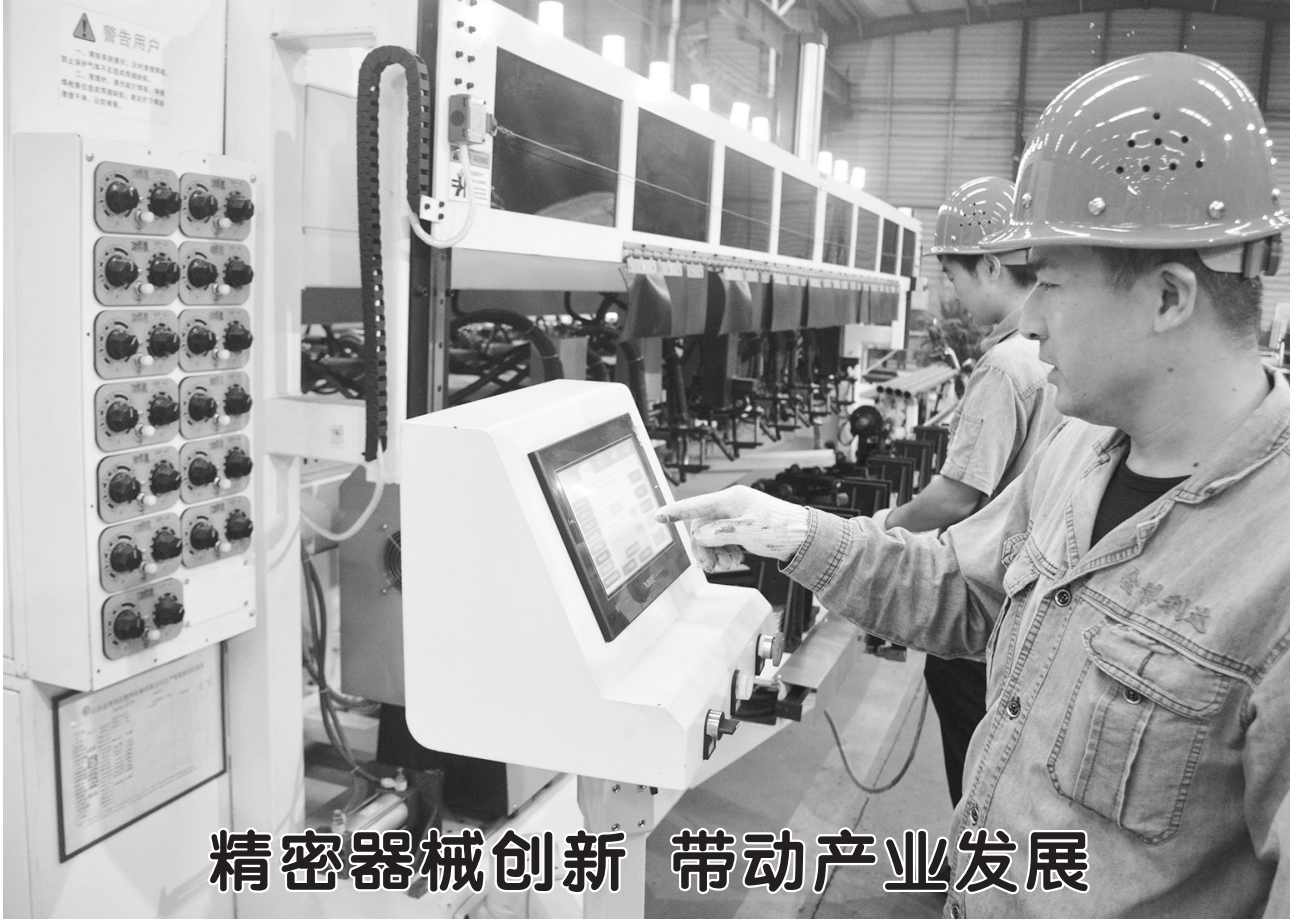
精密器械创新 带动产业发展

“希望之家”生活重建康复训练培训班由菏泽市医专附院承办,进行为期20天的集中封闭式培训训练,培训期间学员食宿费、课程内的训练费等均由主办方承担。培训期间由康复医师、康复治疗师、社会工作者、心理治疗师、生活训练员、辅具工程师、社会志愿者组成服务团队,采取机构训练与社会训练相结合、专业指导与伤友互动相结合、改善生活自理能力与社会参与能力相结合等方式,从生理功能、体能状况等方面对伤友进行评估,依据主要功能障碍和个性化特点,进行日常生活自理能力训练、残存肌力训练、社会适应能力训练、脊髓损伤相关理论课程培训、心理团体课程、无障碍知识、轮椅操控等。有意向报名者向户籍所在地残联报名,报名时间截止10月10日,按照报名先后顺序录取。相关咨询电话:0530-7706718。