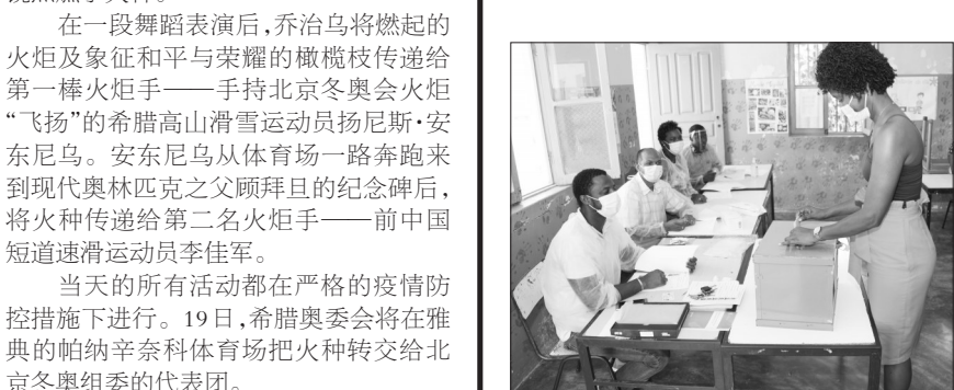
▲10月17日，一名选民在佛得角首都普拉亚一处投票站投票。

据新华社达喀尔10月17日电 佛得角17日举行总统选举，包括若泽·马里亚·内韦斯和卡洛斯·韦加两名前总理在内的7名候选人角逐下届总统。 根据佛得角全国选举委员会的数据，本次总统选举注册选民约40万，其中包括约34万境内选民。选举投票于当地时间17日7时开始，18时结束，选民将在1294个投票站进行投票。