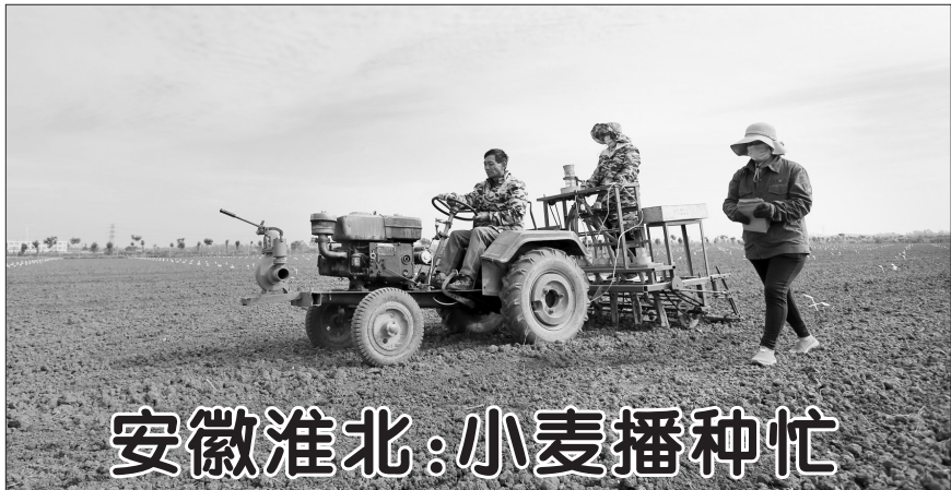
▲10月18日，淮北市濉溪县百善镇徐楼村一家种业公司的工人正在进行小麦良种繁育播种。 眼下正值麦播时节，安徽省淮北市各县区农民抢抓农时，做好冬小麦播种工作，田间一派忙碌景象。 新华社发

型）。 西安市疾控中心主任陈保忠介绍，截至10月18日8时，西安市已追踪到7人密切接触者1553人，其中1133人核酸检测阴性，其余结果待出；外地密接266人，均转当地协查。已追踪到次密接457人，其中54人核酸检测阴性，其余结果待出；