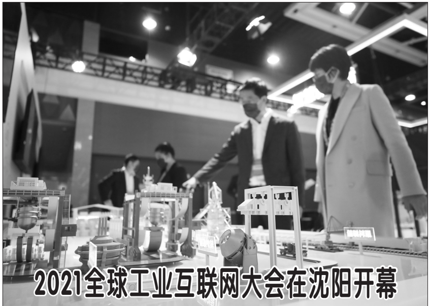
这是10月18日在2021全球工业互联网大会华为技术有限公司展区拍摄的5G+智慧钢铁项目。 当日，2021全球工业互联网大会在沈阳新世界博览馆开幕，本次会议以“赋能高质量·打造新动能”为主题。

新华社北京10月18日电（记者 姜琳）18日，人力资源和社会保障部、民政部、退役军人事务部、全国总工会、全国工商联五部门联合开展的“2021年金秋招聘月”活动正式启动。活动为期一个月，以“就”在金秋、“职”面未来”为主题，为各类企事业单位和社会组织及登记失业人员、离校未就业高校毕业生、退役军人等求职人员提供集中服务。 据人社部就业司相关负责人介绍，招聘月期间，各地将开展“送服务上门”、重点企业用工常态化服务、“金秋访企”、“我为群众讲就业政策”等活动，帮助企业解决