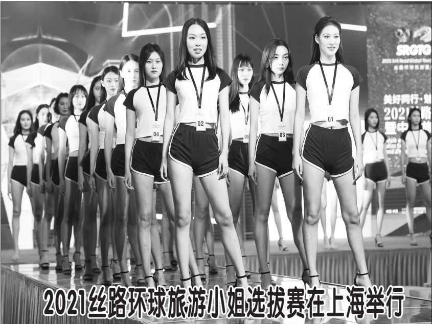
10月18日，参加2021丝路环球旅游小姐选拔赛的选手在进行活力展示。 当日，“美好同行·魅力魔都”2021丝路环球旅游小姐选拔赛在上海举行。“丝路环球旅游小姐选拔赛”是国内自主品牌的国际级选美赛事，旨在以“以美丽经济为抓手，以时尚文化创意品牌”推动文化旅游产业的发展。

新华社北京10月18日电（记者 魏玉坤 谢希瑶）国家统计局18日发布数据，初步核算，2021年前三季度中国国内生产总值823131亿元，同比增长9.8%，两年平均增长5.2%，其中三季度同比增长4.9%，两年平均增长4.9%。 国家统计局新闻发言人、国民经济综合统计司司长付凌晖在当天举行的国新办发布会上说，前三季度，国民经济总体保持恢复态势，结构调整稳步推进，推动高质量发展取得新进展。