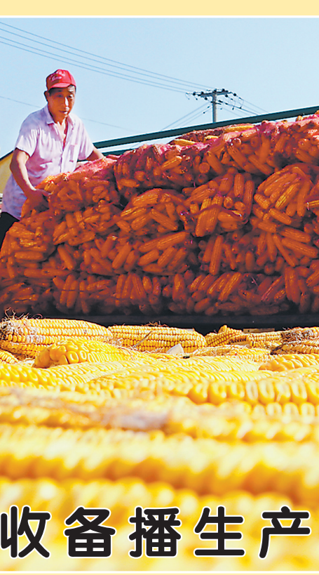
▲10月13日，牡丹区王浩屯镇观音王村村民在堆放晒干的玉米。牡丹区农民抢抓晴好天气对玉米进行收获、晾晒、储藏、销售，乡村处处呈现出忙碌景象。针对今年雨水较多的特殊天气情况，牡丹区高度重视，周密部署，采取多种形式宣传指导群众做好秋收备播工作，为农业生产顺利开展提供支持和保障。