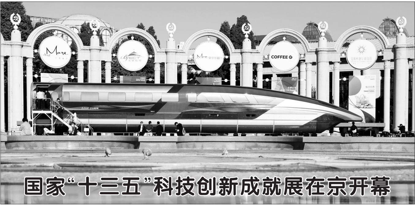
国家“十三五”科技创新成就展在京开幕

式绿色转型成效显著，碳减排扎实推进，城市整体性、系统性、生长性增强，“城市病”问题缓解，城乡生态环境质量整体改善，城乡发展质量和资源环境承载力明显提升，综合治理能力显著提高，绿色生活方式普遍推广。 到2035年，城乡建设全面实现绿色发展，碳减排水平快速提升，城市和乡村品质全面提升，人居环境更加美好，城乡建设领域治理体系和治理能力基本实现现代化，美丽中国建设目标基本实现。