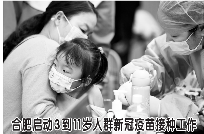
合肥启动3到11岁人群新冠疫苗接种工作