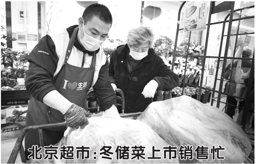
北京超市:冬储菜上市销售忙

11月2日,邢台市襄都区政务服务“跑腿哥”上门为一家企业收取办理业务所需资料。 近年来,河北省邢台市持续推动政务服务向基层延伸,积极推行政务服务“跑腿哥”上门为群众帮办代办服务,实现便民、惠民,提升行政服务效能。截至目前,全市5342个村(社区)综合服务站已配备帮办代办人员6453人,其中帮办代办专职人员3213人。