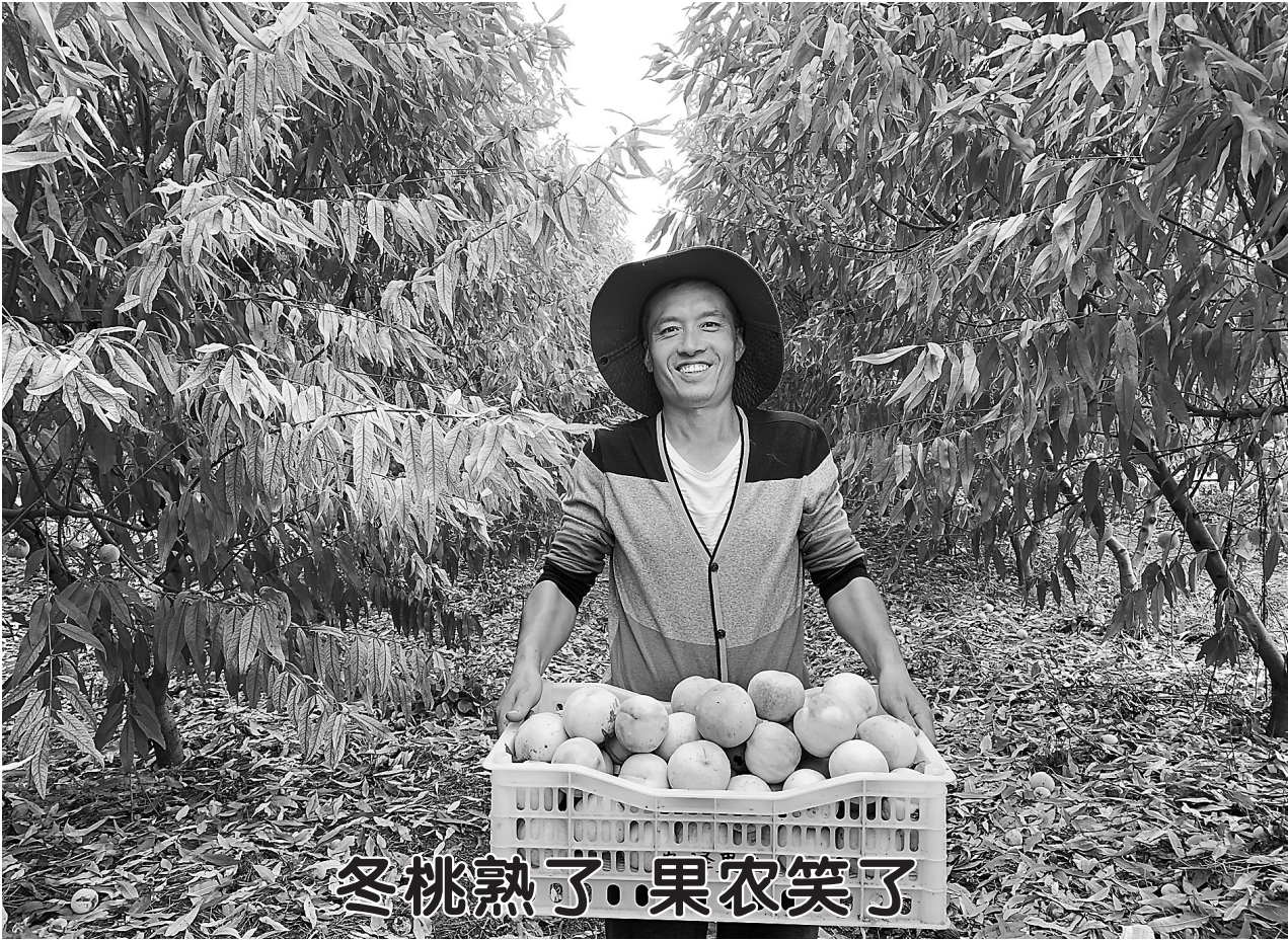
冬桃熟了，果农笑了。

市应急管理局相关负责人表示，通过危险化学品重大危险源企业专项检查督导，既有效解决我市技术性人员力量不足的问题，实现辖区内重大危险源企业的全覆盖检查督导，又提高问题隐患整改效率，通过问题隐患的线上录入，实现问题隐患的在线检测、在线督导整改。同时落实了企业安全生产主体责任，严密管控重大危险源安全风险，巩固“消地联合”监管机制，实现对辖区内一、二、三、四级重大危险源专项检查 100% 覆盖。