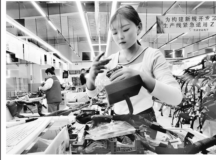
为构建新规开发部 生产线紧急适用Z