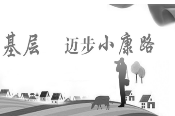
记者走基层 迈步小康路