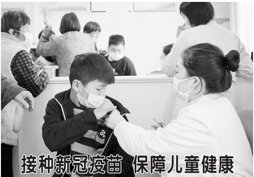
接种新冠疫苗 保障儿童健康