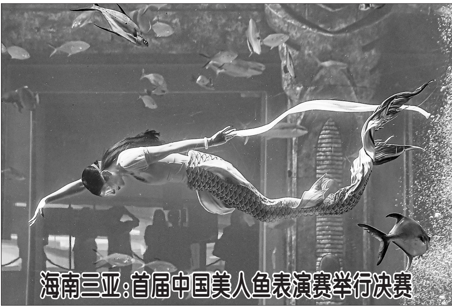
12月22日,首届中国美人鱼表演赛参赛选手在比赛中。当日,由国家体育总局水上运动管理中心等单位主办的首届中国美人鱼表演赛在海南三亚亚特兰蒂斯举行决赛。