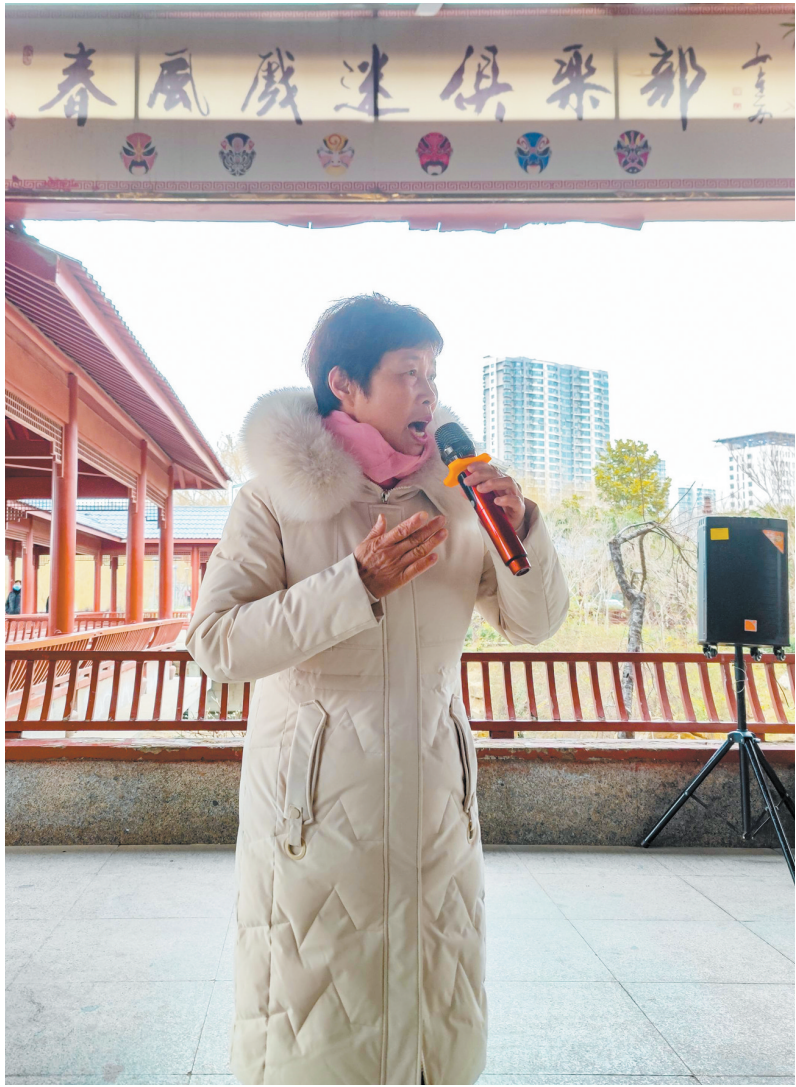
市民直播歌唱新时代