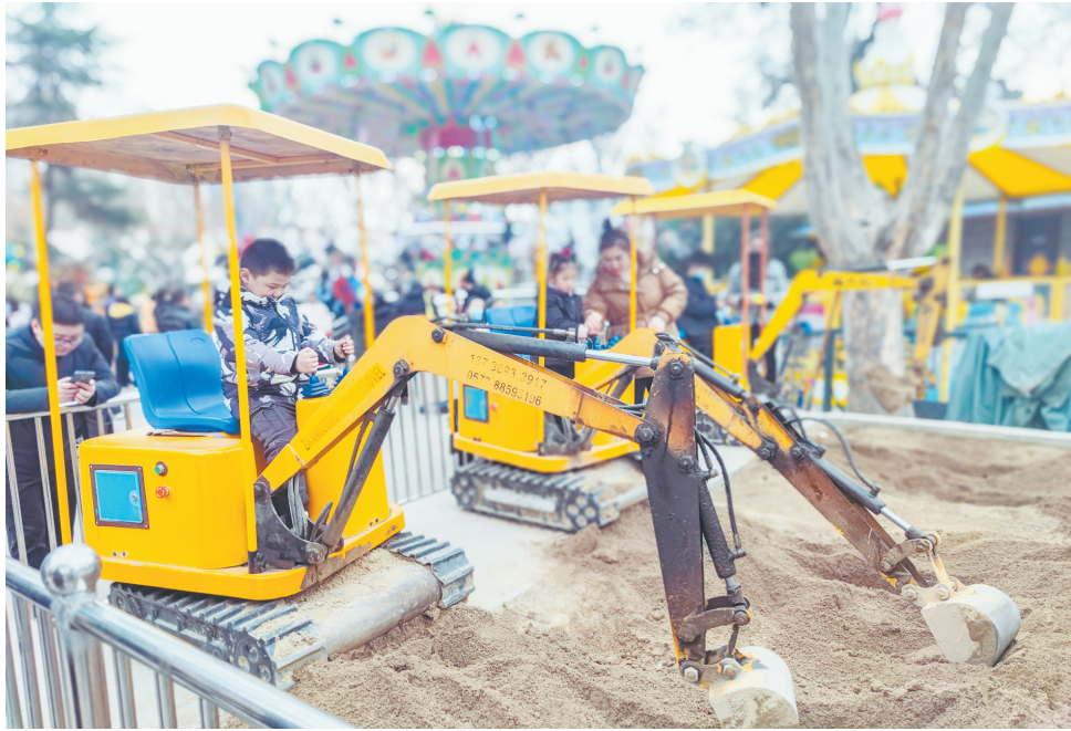
科技感十足的“模拟挖掘机”