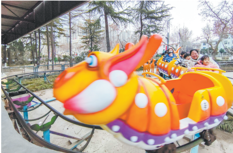
坐上毛毛虫过山车,全家乐融融