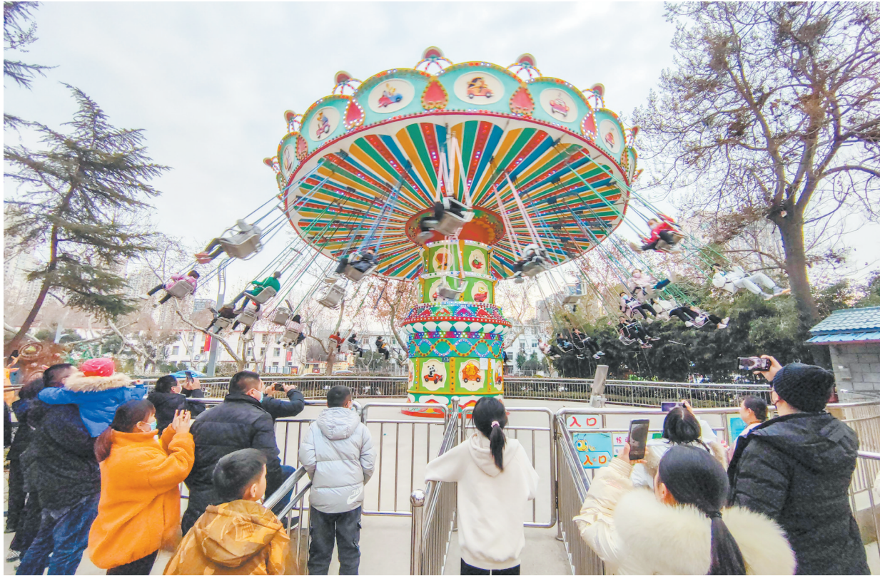
紧张又刺激的旋转飞椅