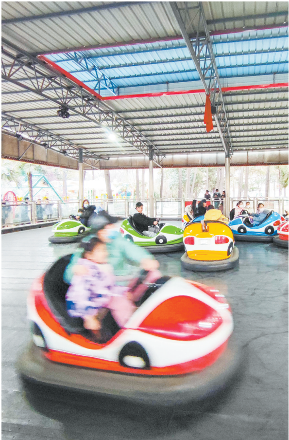
碰碰车是大人小孩的最爱