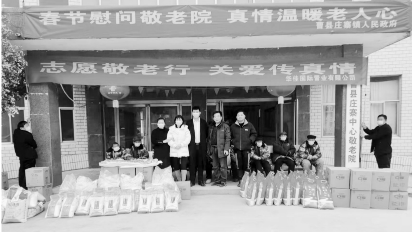
▲春节前夕，菏泽天方装饰材料有限公司、华佳国际置业有限公司等企业分别为曹县庄镇敬老院老人送去了猪肉、羊肉、米、面、油等，让老人们过一个欢乐幸福的春节。与此同时，庄镇镇党委、政府向敬老院补贴2000元现金，用于改善敬老院老人春节期间的的生活。