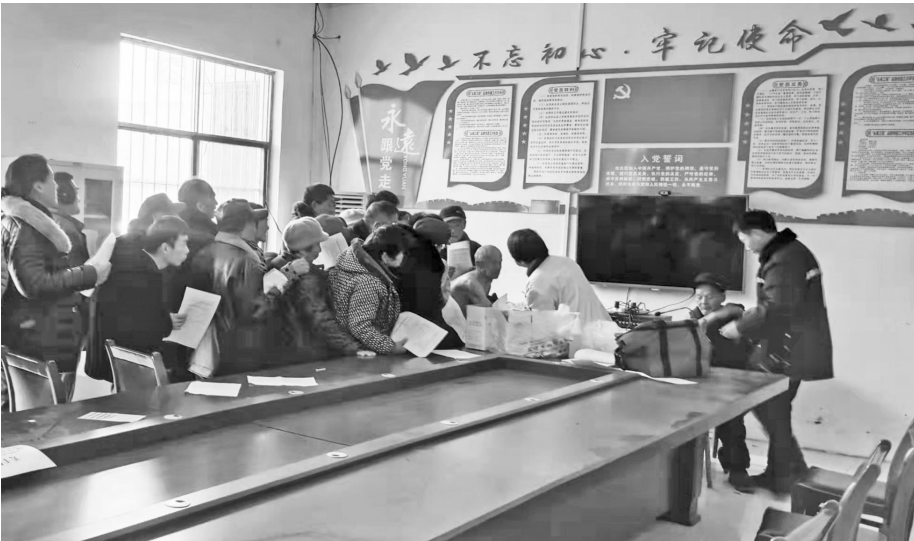
▲2月7日，曹县青荷街道在边远村庄党群服务中心设立了3处第三支新冠疫苗流动接种点，把接种点搬到群众家门口，让群众及时接种第三支疫苗，为群众健康安全构筑绿色屏障。

此次慰问，是曹县返乡创业（深圳）服务站连续第五年走访慰问家乡群众。曹县返乡创业（深圳）服务站、深圳（曹县）商会鼓励在深圳创业企业家承担社会责任，回馈社会，用实际行动向社会传递正能量。