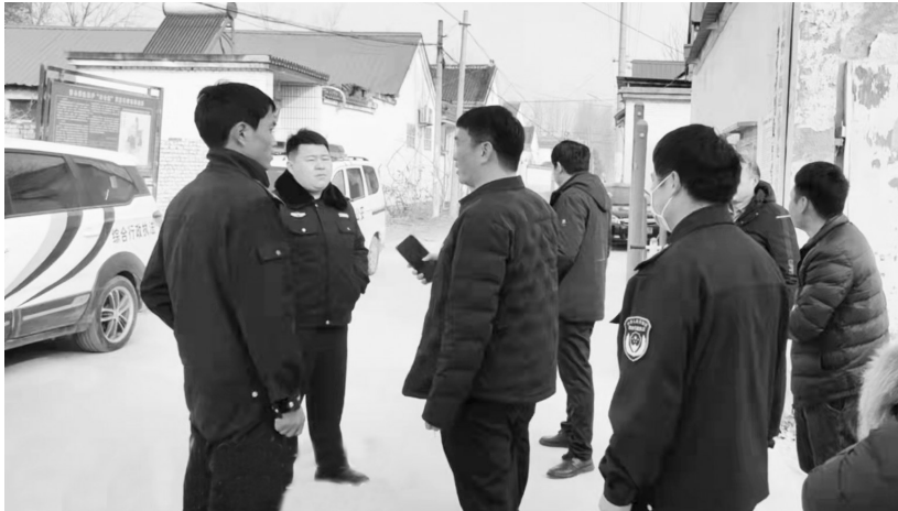
▲2月9日上午，曹县磐石街道开展烟花爆竹禁售禁燃禁放排查、管控活动。街道按照“网格化”包靠分工，组织各村党员干部持续加强巡逻管控工作，并发动各村居“网格员”以轮班值守方式对重点时间节点加强巡逻，及时劝阻燃放烟花爆竹行为。图为工作人员在宴堂村排查中。

备停车、充电、如厕、热水供应、临时休息、车辆加水、路网图、垃圾回收等基本服务。实行了24小时运营服务，室内休息室白天开放时间不少于8小时。孙老家公路驿站成为春节期间服务返乡游子出行的“家”。