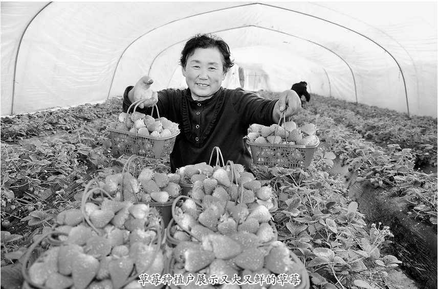
草莓种植户展示又大又鲜的草莓