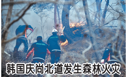
韩国庆尚北道发生森林火灾