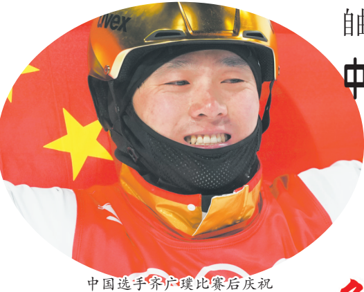
中国选手齐广璞比赛后庆祝