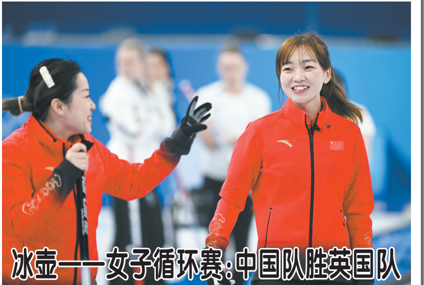
冰壶——女子循环赛:中国队胜英国队

国际奥委会新闻发言人马克·亚当斯说:“我们正在非常非常成功地举办世界上最复杂的国际比赛或活动之一。(疫情防控)是(冬奥会)保障工作上的一个挑战,我要向我们的中国朋友和同事们致敬,他们做得真的非常棒。”