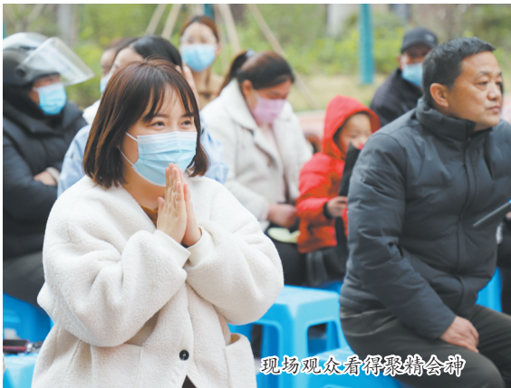
现场观众看得很投入

作为菏泽首个100万方沉浸式地标商业综合体,亿联世贸广场集运动城、生活馆、品牌轻奢馆、名品店、潮牌集合店、中西美食、婚纱摄影、婚庆主题酒店、儿童主题乐园、艺术教培、酒吧娱乐、休闲运动等功能于一身,汇集吃、喝、玩、乐、购,将打造城市24小时潮玩街区,成为菏泽商业地标新势力。项目负责人表示,此次七号公馆婚纱摄影的签约进驻,势必会掀起新一轮的招商进驻热潮,聚焦更多行业目光,引领更多远见卓识的商家签约进驻。