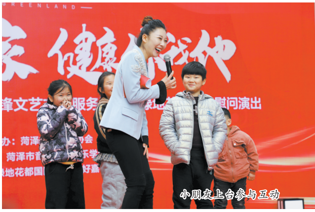
小朋友上台参与互动