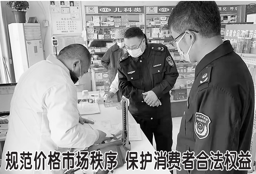
规范价格市场秩序 保护消费者合法权益

据悉，三部门单位还将开展形式多样的巡回报告、学习实践、宣讲交流、典型访谈等活动，加强“青创先锋”典型学习宣传，引导广大青年不断从先进身上汲取精神营养，激励广大团员青年发挥聪明才智、积极创新创效，为全市实现“四个突破”和“231”特色产业建设发挥生力军和突击队作用。