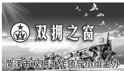
菏泽市双拥工作领导小组主办

会议指出，2021年，巨野县退役军人工作以开展“法律政策落实年”活动为契机，结合党史学习教育，精准精细搞服务，用心用情办实事，全县退役军人工作取得新成效。一年来，全县退役军人工作坚持思想引领，退役军人合法权益得到切实保障；坚持瞄准需求，安置就业及军休服务质量持续提升；坚持浓厚氛围，拥军优抚成效有力彰显；坚持循环英烈，纪念设施得到修缮保护；坚持紧扣基层，