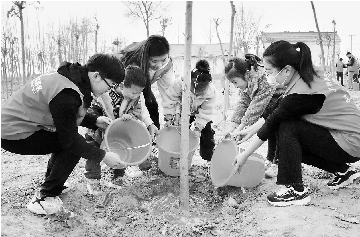
大手牵小手 共植一片绿 3月12日，定陶区杜堂镇团委组织60余名青年志愿者，和镇里的孩子们一起，在张庄、裴河等村种植树苗240棵，进一步弘扬了志愿服务精神，培养了孩子们的环保意识，为美丽乡村建设增添了一份青春、靓丽、活跃的新绿。

办好群众身边的“关键小事”。大力推广养老保险“静默认证”、车辆检测“交钥匙”等服务模式，让与群众生活密切相关的“关键小事”实现省心办、快速办、无感办。全面推行水电气暖信等“一站式”服务，持续打造“纳税人之家”服务品牌，提升经常性涉企服务水平。（赵小菊）