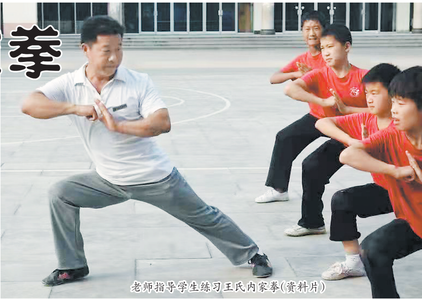
老师指导学生练习王氏内家拳(资料片)

相传明弘治年间,王显曾孙王隆,到巨野县大义镇赶集,在集上看到一集霸欺负外乡生意人,上前劝阻。集霸看见王隆只有十二三岁,根本不把他放在眼里,伸手推王隆。王隆轻轻一拨,紧接一个顺手牵羊,集霸顿时像断木一样跌倒在地上。集霸的两个跟班不肯罢休,高举着菜刀、木棍扑上来。王隆不慌不忙,等他们离近了,一个扫堂腿,把二人打倒在地,半天没有爬来。戊午年间,王隆考上举人,任萧县知县,后转安庆通判。他每到一地,都将地痞恶霸整治得服服帖帖,劳苦百姓无不拍手称赞。同时,他还将本不外传的郓城县王氏内家拳带到各地,传授给百姓强身健体,保护自己。 1937年7月7日,卢沟桥一声炮响,中华民族陷入危亡时刻。11月9日,日军越过黄河,自西向东侵犯齐鲁大地。郓城土匪头子石殿华乘机搜刮民财,大白天进村抢人抢东西,不少村户都被洗劫一空。土匪也看上了王庄的金银财宝和牛羊骡马。一天晚上,石殿华纠集1000余名匪徒,从四面包围了王庄,当时王庄全村人口不到800人,可是他们不怕邪恶,不惧死亡。300多名王氏族人,手持春秋大刀、长枪、短棍,甚至抓钩、铁钩,坚守寨门和孩儿墙,与匪徒激战7天7夜,打死打伤匪徒400多人,最终打退了匪徒的进攻,保卫了王庄村民