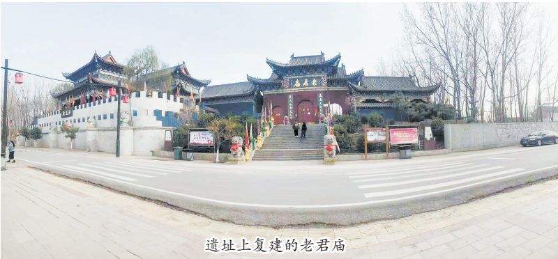
遗址上重建的老君庙

在如今的单县浮龙湖湖畔,有一个传说中叫老君寨的村落和一座叫老君庙的名刹。一寨一庙均与老子隐居此地有密切关联。 老子姓李名耳,春秋时陈苦县厉乡由仁里人(今河南省鹿邑县),周守藏室之吏、著名思想家、道德家。老子以“道”诠释宇宙万物之变,著有《道德经》,被后世道家尊称为“祖师”和“太上老君”。 据老君庙碑文考,老子生于天皇初年,通晓天然之理。因周室衰微,而由今河南鹿邑老家退隐函谷关,途经单父(单县古称)一村落李集,并久待时脩。此隐居的李集村被众谓之“老君寨”。 当时的李集村位于孟渚泽(今浮龙湖遗址)中的土丘之上。孟渚泽烟波浩渺,村野清静幽深,老子常驭青牛于阡陌交通,修道授业、施药除病,声振遐迩,求道者络绎不绝,便形成了人烟密集、幅员辽阔的村落群体,老君寨又被统称为“老君十八寨”。 传说,“老君十八寨”由老子教化建筑布局,按子午排定,上应太阳、太阳、五星、六曜,下合五岳、四渎、三才、六府,具有“万里古堤环寨外,一溪流水贯其中”之说。 旧时,战事不绝,硝烟非尽,孟渚泽一带的百姓避乱于老君寨而安然无恙。9年后,老子离开孟渚泽,西至函谷关,老君寨的百姓建庙以祭之,称谓“老君庙”。 据老君庙石碑考:唐明皇去泰山封禅返京途中经过老君寨,拜谒老子后,帮款重建老君庙,后经历代整修扩建,至清为止,其规模宏大,气宇非凡,成为单县八大寺院之一。 当初的老君庙有三重门、藏经楼,殿堂三十余间,左右前后还有天爷庙、关帝庙、财神庙、峨眉姑娘庙、韦驮庙和徐公祠等,层阁叠嶂、翘角飞檐,形成“一观多庙,庙庙相连”的壮观景象。正殿东西各列六幢配殿,供奉历代得道成仙之祖,正门刻有清代大学士礼部尚书刘墉所题对联: