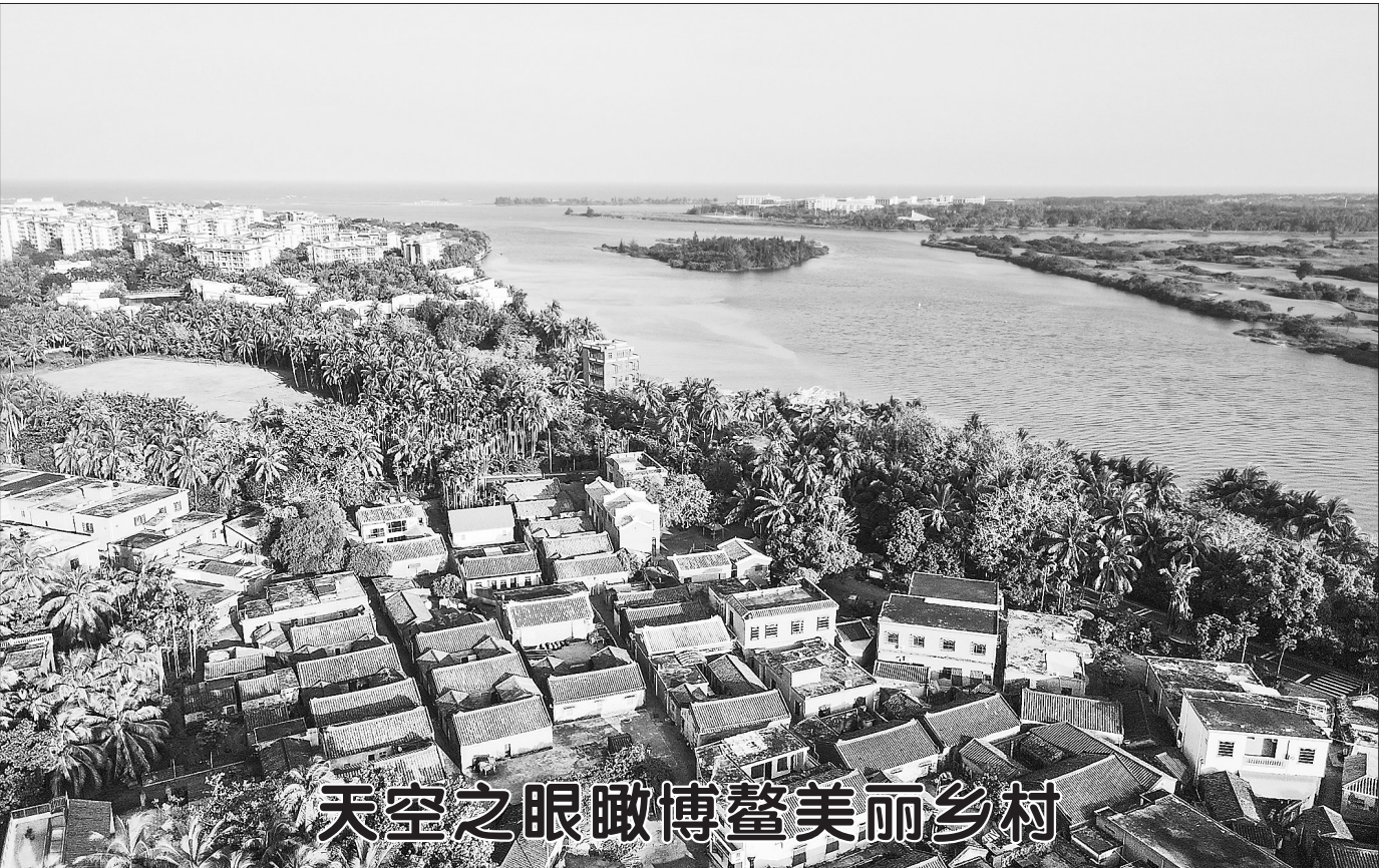
天空之眼瞰博鳌美丽乡村

十三届全国人大常委会第三十四次会议在京举行 审议期货和衍生品法草案、职业教育法修订草案等 栗战书主持 据新华社北京4月18日电 十三届全国人大常委会第三十四次会议18日上午在北京人民大会堂举行第一次全体会议。栗战书委员长主持。会议听取了全国人大宪法和法律委员会主任委员李飞作的关于期货和衍生品法草案审议结果的报告。草案三审稿进一步加强对衍生品交易的监管;完善相关合约概念的规定等。会议听取了宪法和法律委员会副主任委员徐辉作的关于职业教育法修订草案审议结果的报告。草案三审稿进一步突出职业教育的就业导向,加快培养技术技能人才;将社会主义核心价值观进一步融入职业教育;建立健全现代职业教育体系等。宪法法律委认为上述2项草案已比较成熟,建议提请本次常委会会议审议通过。会议听取了徐辉作的关于体育法修订草案修改情况的汇报。草案二审稿体现中华体育精神的内容;增加基本公共体育服务供给的规定,对发展青少年体育和学校体育的内容予以完善等。会议听取了宪法和法律委员会副主任委员刘季幸作的关于黑土地保护法草案修改情况的汇报。草案二审稿完善有关黑土地范围的规定,突出黑土地对粮食安全的保障作用,加强黑土地保护科技支撑和技术服务等。会议听取了宪法和法律委员会副主任委员丛斌作的关于妇女权益保障法修订草案修改情况的汇报。草案二审稿进一步突出对妇女人身权、人格权的保护;建立报告与排查制度,及时发现和处理侵害妇女权益的违法犯罪行为等。受委员长会议委托,全国人大常委会副秘书长信春鹰就十四届全国人大代表名额分配方案草案、十四届全国人大少数民族代表名额分配方案草案、台湾省出席十四届