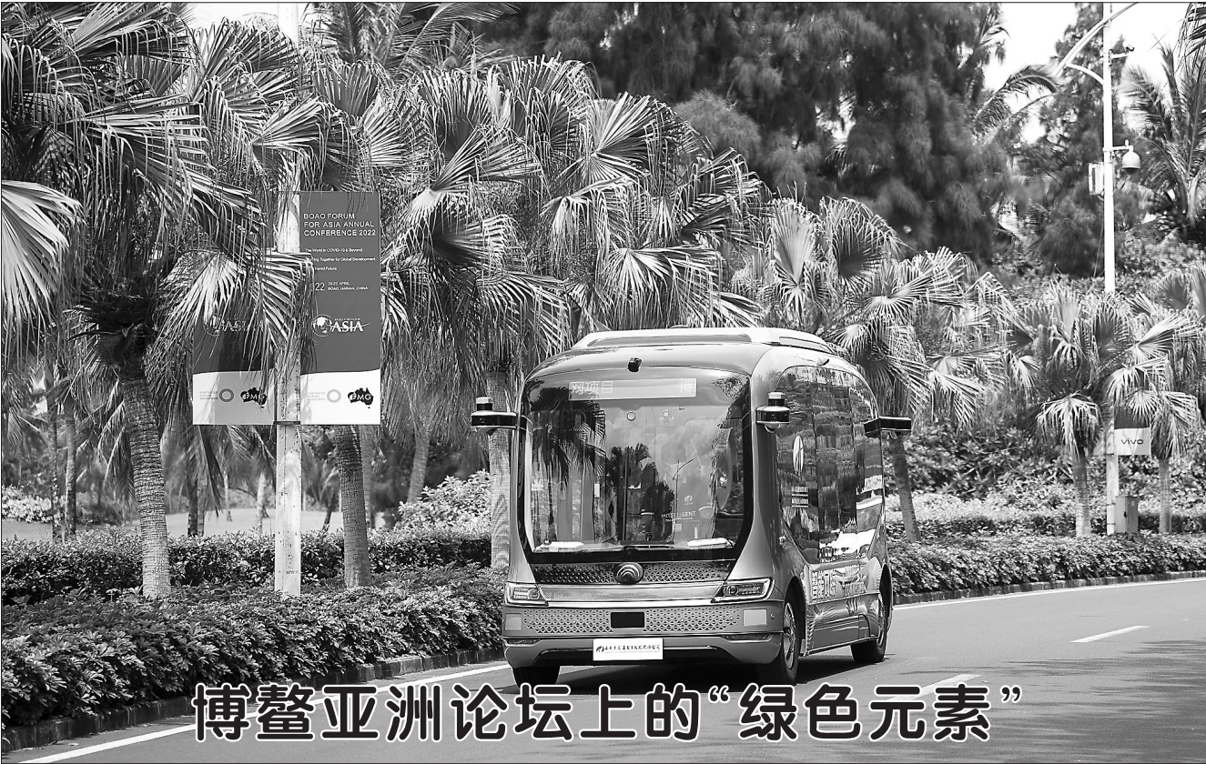
博鳌亚洲论坛上的“绿色元素”

新华社成都4月20日电（记者 董小红）为了改善失能老年人的生活质量，四川省卫生健康委员会近日印发了《2022年四川省失能老年人“健康敲门行动”实施方案》，提出从今年起启动失能老年人“健康敲门行动”，为全省提出申请的20万名65岁及以上失能老年人提供至少两次免费上门健康服务。 记者了解到，失能老年人“健康敲门行动”原则上由具有能力的基层医疗卫生机构承担。基层医疗卫生机构根据需要服务的失能老年人数量，选定家庭医生团队，为提出申请 失能老年人提供“三个一”免费健康服务：开展一次上门健康管理，提供一套上门健康指导方案，开通一条健康咨询热线。 其中，上门健康管理包括健康状况评估、体格检查等，并为不能自理的失能老年人建档立卡；上门健康指导主要包括康复护理指导、健康风险指导、心理支持、就诊转诊建议等服务。 据悉，四川还将动员多方力量参与，按照“个人申请、村级初审、乡镇复审、区县审定”的流程，确定服务对象，加快形成工作合力。