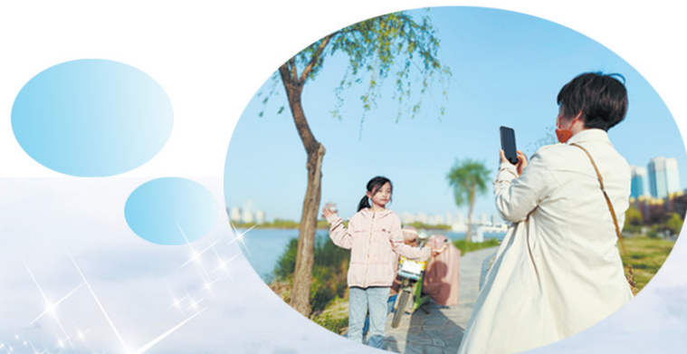
湖边居民打卡留念