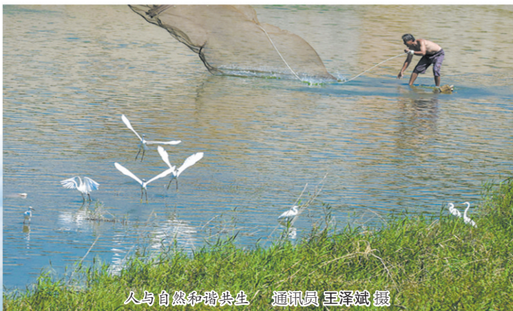
人与自然和谐共生