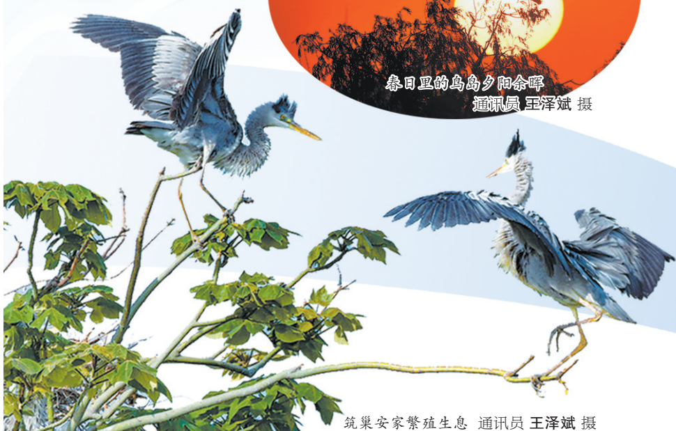
筑巢安家繁殖生息

4月22日是第53个世界地球日,恰逢爱鸟周期间,为切实将“珍爱地球,人与自然和谐共生”和“守护蓝天精灵、共享美好家园”的理念传导至市民心中,市林业局、市科协 and 市公安局森林警察支队在4月23日至29日联合开展“世界地球日暨爱鸟周”系列宣传活动,科普鸟类保护知识,号召大家关爱地球、爱鸟护鸟,积极参与到各项活动中来,让群众看得见绿水、听得见鸟鸣,为生态文明建设和美丽菏泽建设作出贡献。