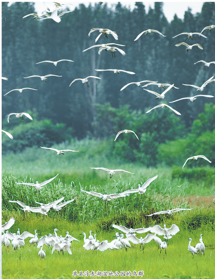
单县浮龙湖湿地公园的鸟群