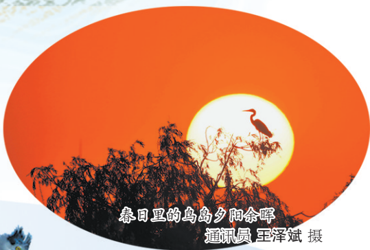
春日里的鸟岛夕阳余晖