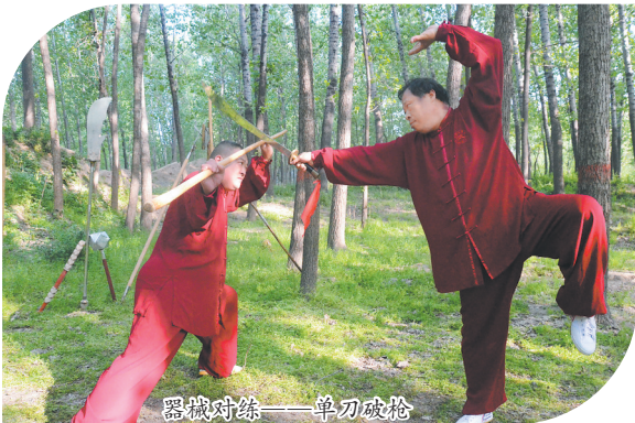
器械对练——单刀破枪