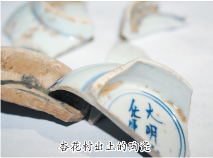
杏花村出土的陶瓷