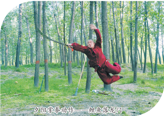
夕阳掌拳动作——鲤鱼落龙门