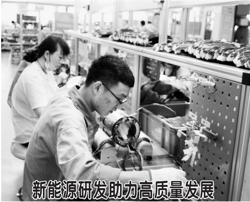
新能源研发助力高质量发展

日前，在市开发区精进新能源汽车电动化动力总成产业化基地项目生产车间里，工人正有序忙碌着。记者了解到，该项目设计年产新能源汽车电动化动力总成30万台套。据悉，精进电动将在菏泽投入国际最高端的齿轮、轴系加工设备，建设百万级高速精密齿轮的加工能力。菏泽也是集团新的研发基地，公司将大力培养人才团队、大力度投入装备和各类工业软件，建设国际领先的研发基地。届时，菏泽将成为精进电动集团最重要的新能源汽车电驱动研发及产业化基地。