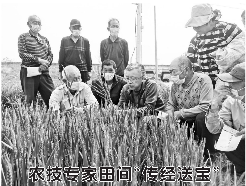
农技专家田间“传经送宝”