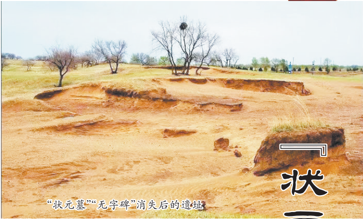
“状元墓”“无字碑”消失后的遗迹

此外，我市总工会推荐的“新冠抗原快速检测试剂盒”“朗韵教育培训，圆梦就业梦”“现代大棚温湿度智能监控系统”“匠工木雕·传承木雕文化”“打造培训新模式，成就事业好未来”等5个项目还分别获得各组专项赛三等奖。