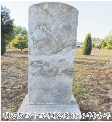
明万历四十四年(公元1616年)古碑