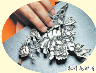
牡丹花瓣清晰可见