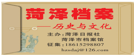
菏泽档案——历史与文化