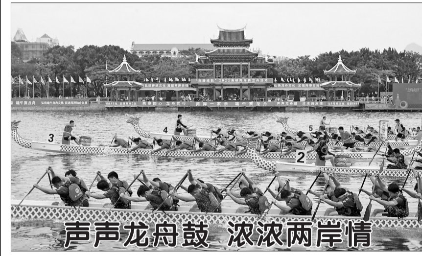
声声龙舟鼓 浓浓两岸情。6月2日,在“龙腾虎跃”2022海峡两岸龙舟活动现场,参加龙舟比赛的龙舟队奋勇争先。