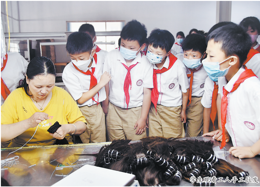
学生观看工人手工拉发

近日,由县委宣传部主办的“山东手造·趣味端午”研学活动在鄆城手造展示体验中心举行。在工作人员的讲解下,学生们详细了解了鲁锦、发制品和羊毛