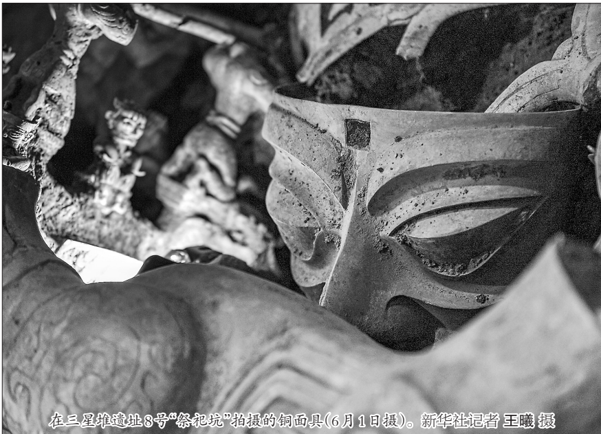
在三星堆遗址8号“祭祀坑”拍摄的铜面具(6月1日报)。