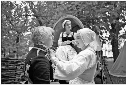
▲6月12日,身着传统服饰的表演者在俄罗斯首都莫斯科参加纪念活动。 6月12日是俄罗斯国庆日——“俄罗斯日”。