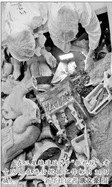
在三星堆遗址8号“祭祀坑”,考古队员在进行挖掘工作(5月31日报)。