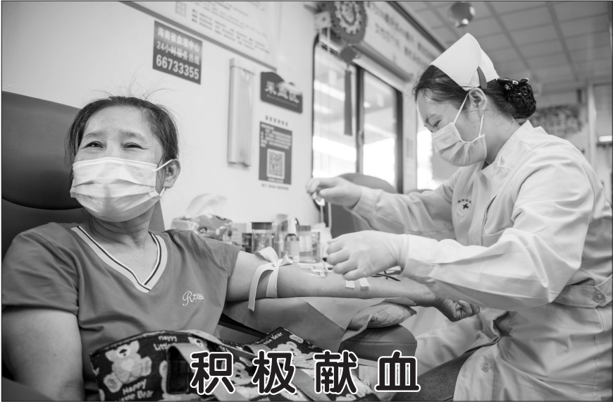
▲6月13日,海南省琼海市民在献血点献血。 6月14日世界献血者日即将到来,各地爱心人士积极献血。

五是规范省以下财政管理。规范各类开发区财政管理体制,推进省直管县财政改革,做实县级“三保”保障机制,推动乡财县管工作提质增效,加强地方政府债务管理。 《意见》强调,各地区、各有关部门要充分认识进一步推进省以下财政体制改革的重要意义,把思想和行动统一到党中央、国务院决策部署上来,增强“四个意识”、坚定“四个自信”、做到“两个维护”,主动谋划,精心组织,周密安排,推动各项改革任务落地见效。